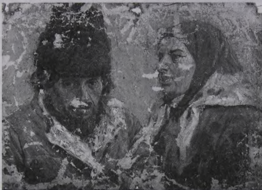
Ил. 2. Максимов В. М. Этюд. Холст, масло. 1880 г. ХМ ВП-601/138

В фондах Музея Природы и Человека представлены несколько типичных этюдов В. М. Максимова без названий. Они выполнены маслом на картоне и холсте, представляют собой пейзажные (Этюд. Кладбище. ХМ ВП-601/137) и портретные зарисовки (Этюд. Силуэты и портреты крестьян. ХМ ВП-601/138-139).