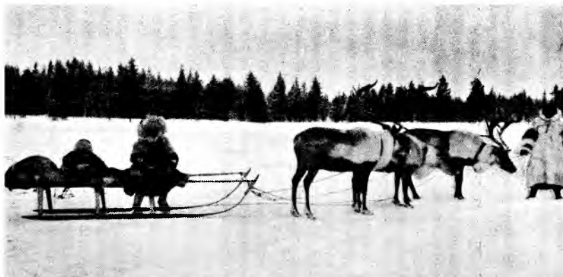
Запряжка в три оленя

езды на оленях. В большей части случаев это действительно возможно: не надобно только слишком уже покоить ноги, действовать, напротив, ими во всех затруднительных случаях, в особенности против колебания кериса. Этого колебания никак не должно, однако ж, останавливать пятками, потому что таким образом всегда можно переломить ногу; сев на керис верхом, необходимо прижать колена крепко к наружным бокам его, а ноги спустить и отклонять керис от камней и деревьев только ступнями. Теория, кажется, простая; не такова практика, потому что олень не дает спохватиться именно тогда, когда это нужно, т.е. при спуске с горы. Он бежит тогда так проворно, что не имеешь времени рассмотреть предметы, тем более что трудно не закрыть глаза от снега, который летит от ног его прямо в лицо. Недурно, в случае нужды, повалить керис