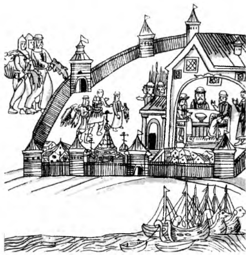
Русский город конца XVI в. в Сибири. С миниатюры С.У. Ремезова из Кунгурской летописи XVII в.

«Погода весь день стоит переменная, пасмурная с небольшим ветром, поэтому переселенцы больше сидят внизу, в барже, предпочитая духоту ветру и дождю. Но вот показалось солнце, один по одному начали выбираться переселенцы из баржи на палубу. Все они разделились на несколько кружков. Женщины оживленно о чем-то толкуют, ребятишки затевают игры в «вершки», а большинство уселись чинно возле матерей и играют в «лепки», которые, по всей вероятности, сделаны или в Тюмени во время долгого «сидения», а то, по-