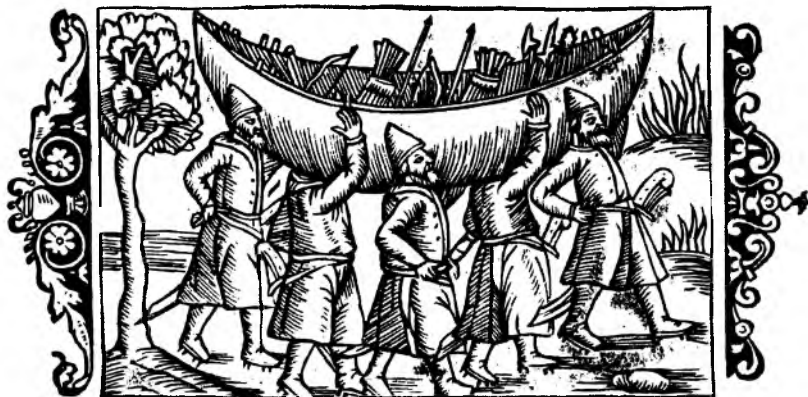
Перенос лодки через волок. С гравюры XVI в.

Я начинаю «ждать», то прохаживаясь до пристани, то присаживаясь куда-нибудь. Моя