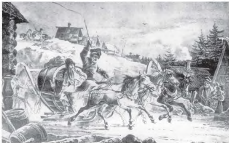
А.О. Орловский. Тройка. С литографии XIX в.

Впрочем, подобные указы мало удерживали лихачей. Значительно более эффективным сдерживающим фактором было, выражаясь современным языком, качество дорожного покры-