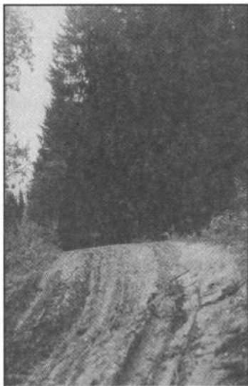
Бабиновская дорога сегодня.