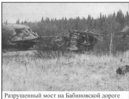
Разрушенный мост на Бабиновской дороге