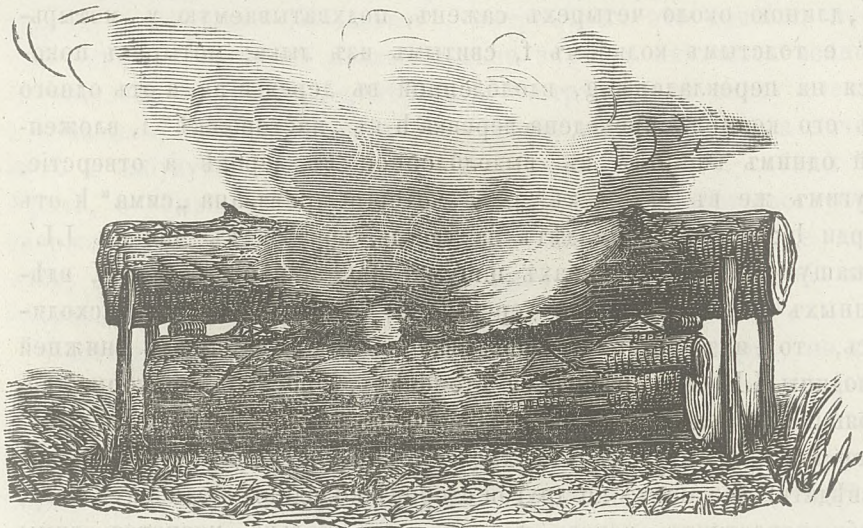
Н о д ѣ я .

Ловить оленей капканами начинаютъ по снѣгу, и чѣмъ глубже снѣгъ, тѣмъ добычливѣе ловля. Капканы вѣсятъ не болѣе 18—20 фунтовъ и ничѣмъ не отличаются, кромѣ ббльшей величины, отъ волчьихъ или лисьихъ. Ставятъ ихъ обыкновенно въ ельникахъ, на тропахъ, или на переходахъ у поѣди. Для того, чтобы поставить капканы, нужна большая сноровка, въ особенности такимъ образомъ, чтобы изъ идущихъ одной тропой пошло два и три звѣря сразу. Здѣсь многіе промышленники сьумѣютъ