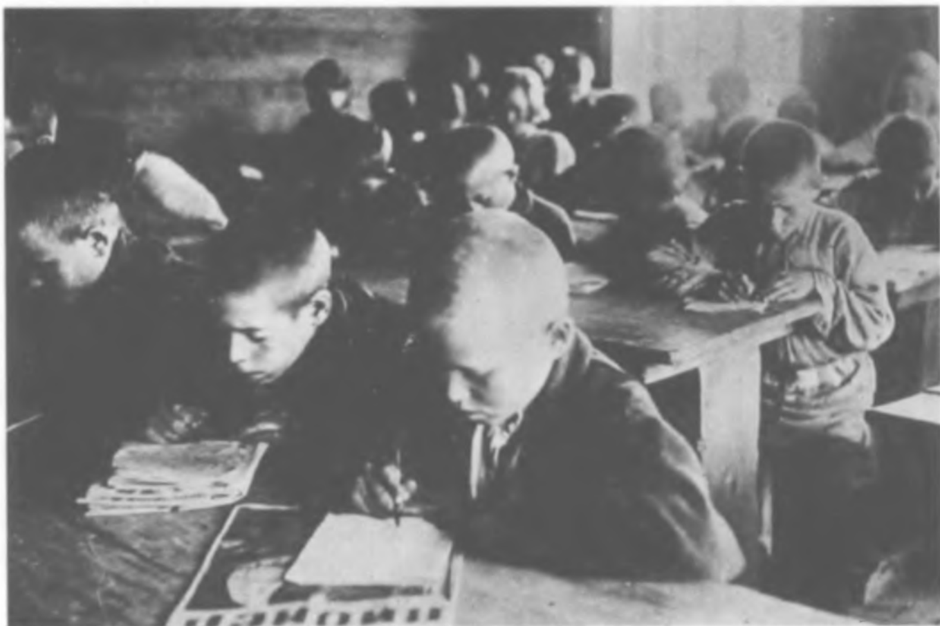
Дети спецпереселенцев в одной из школ нарымских комендатур