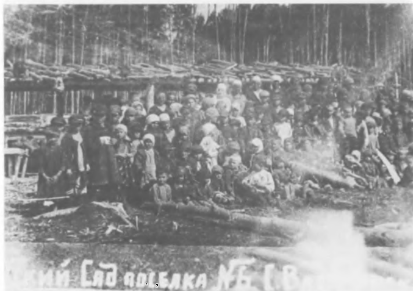
Детский сад в пос. № 6 Средне-Васюганской комендатуры