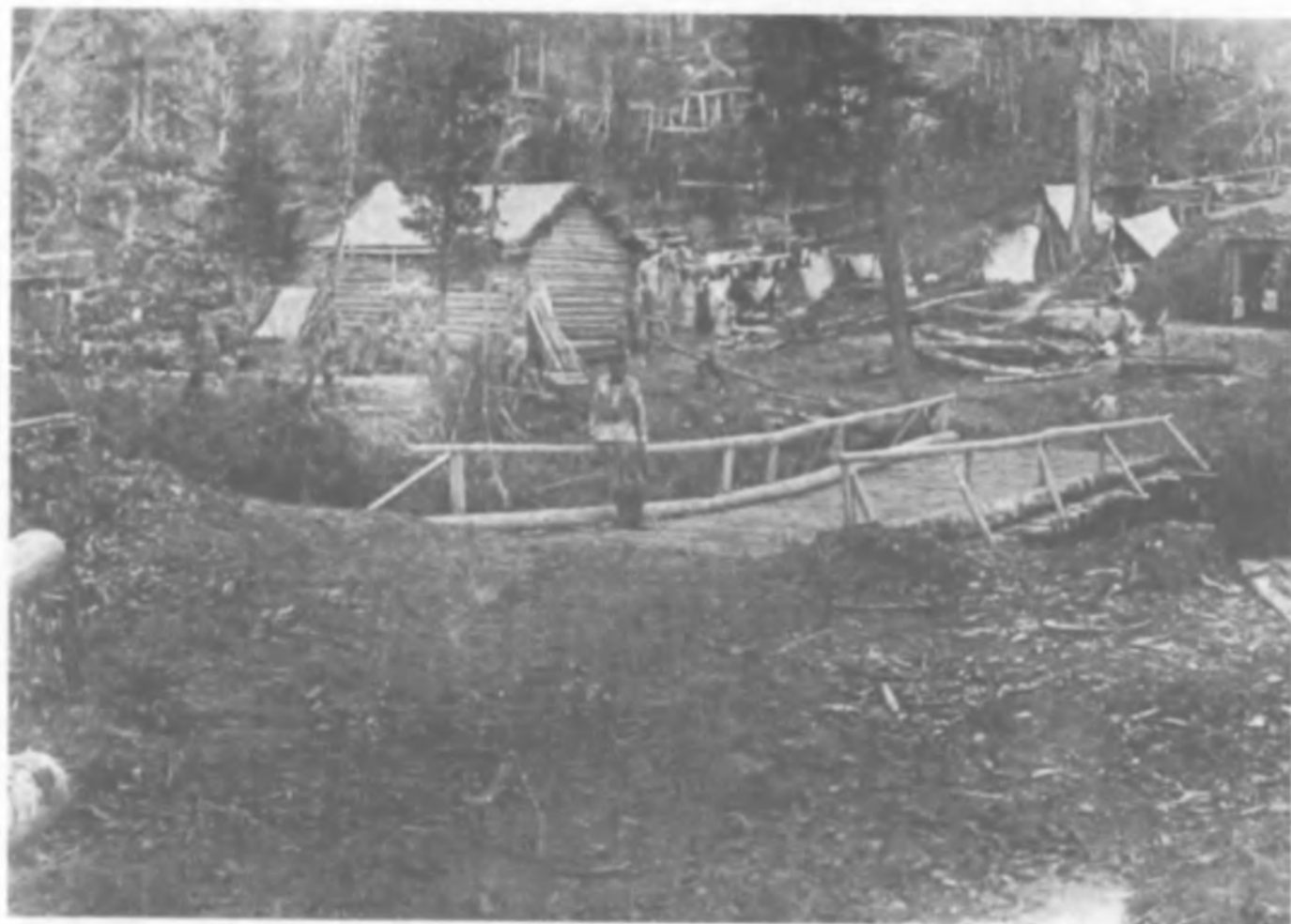
Начальный этап строительства одного из спецпоселков