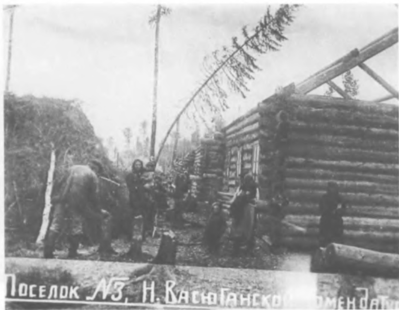
Строительство барачов в нос. № 3 Нижне-Васюганской комендатуры