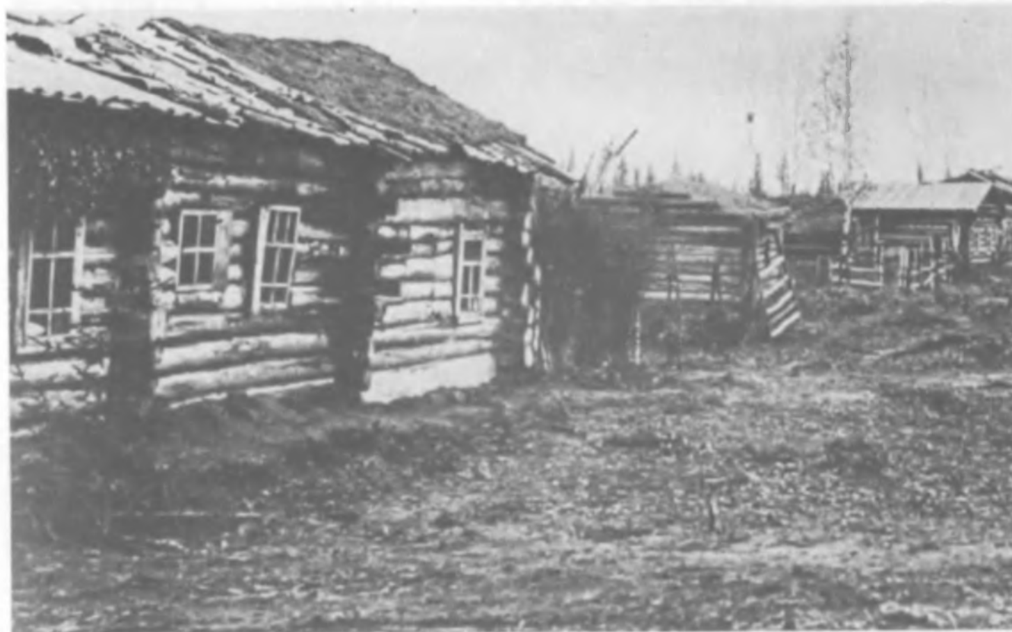
Баракы в одном из спецпоселков нарымских комендатур