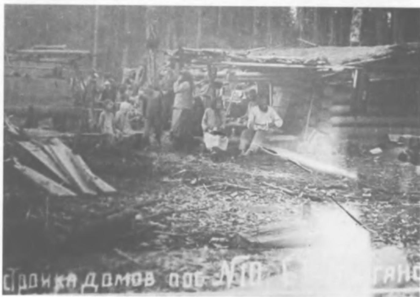
Постройка домов в пос. № 10 Средне-Васюганской комсндратуры