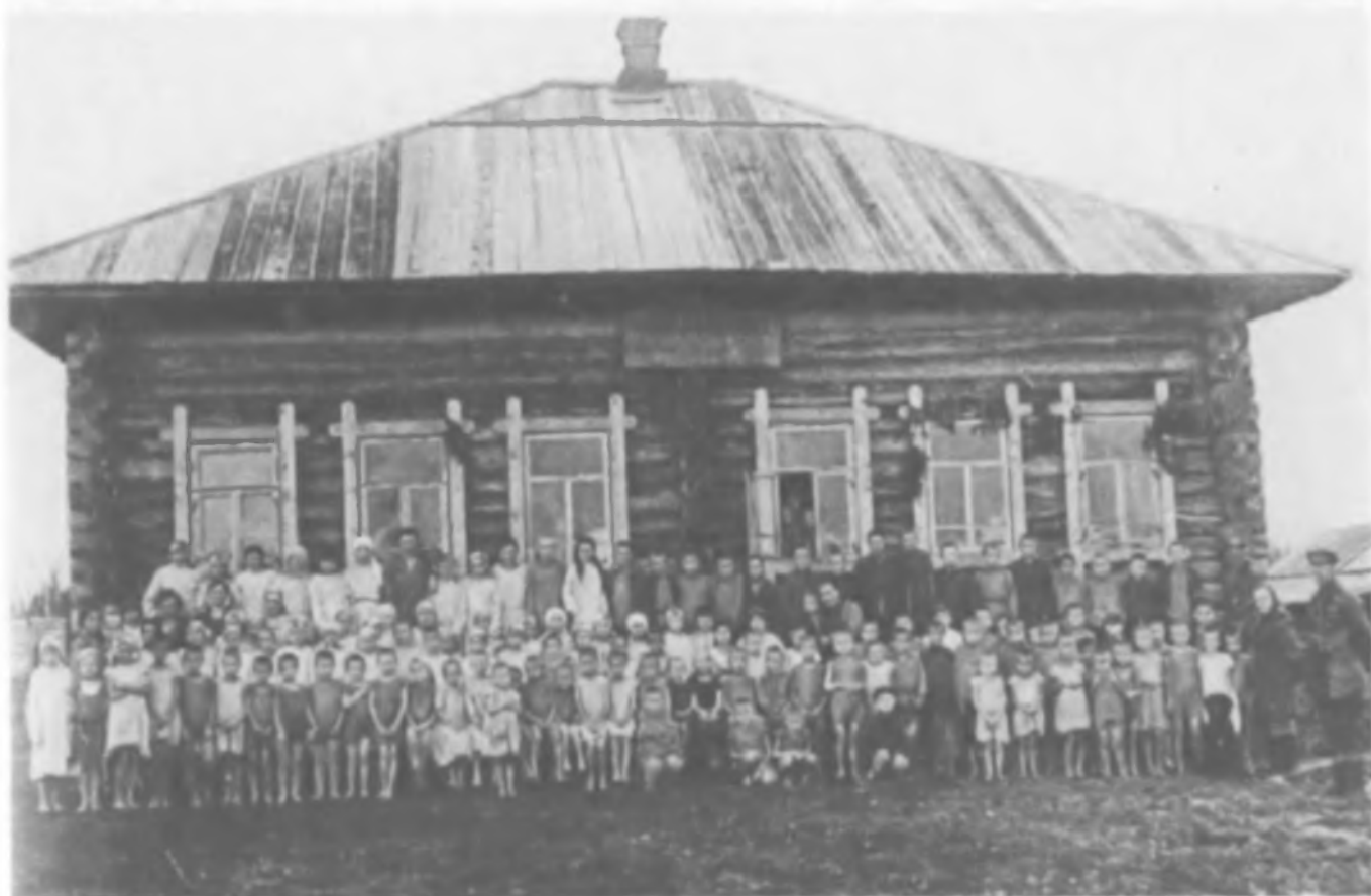
Дети-сироты и воспитатели в одном из детских домов нарымских комендатур