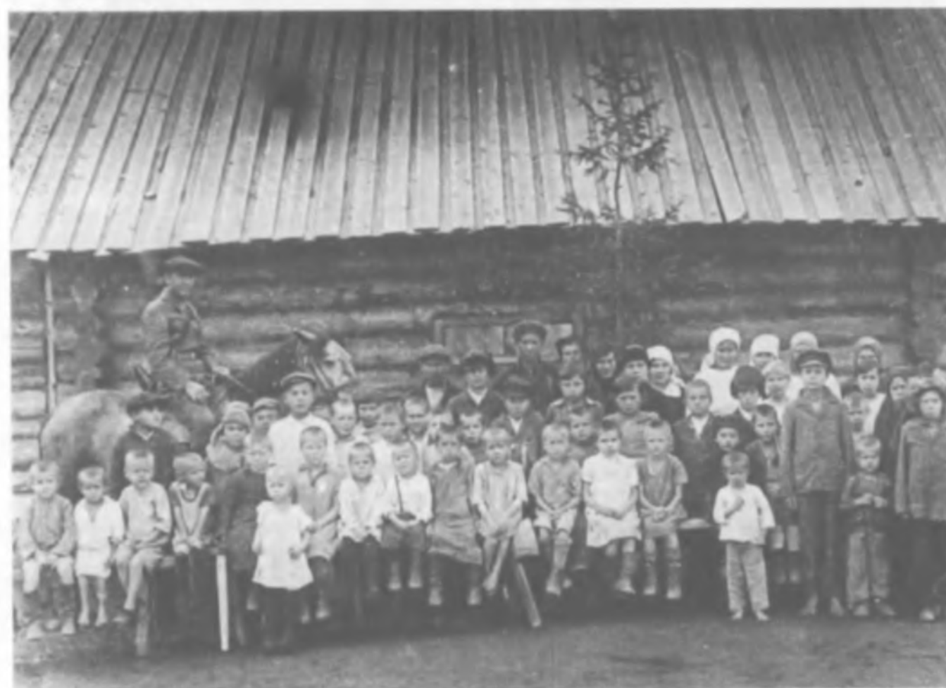
Дети-сироты и воспитатели в одном из детских домов нарымских комендатур. Слева на лошади поселковый комендант