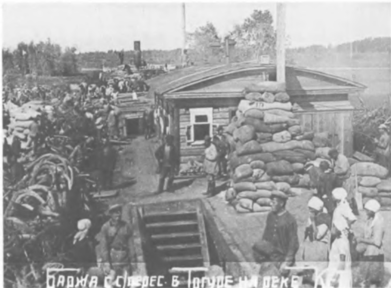
Баржа со спецпереселенцами в районе пос. Тогур на р. Кеть (приток р. Обь)