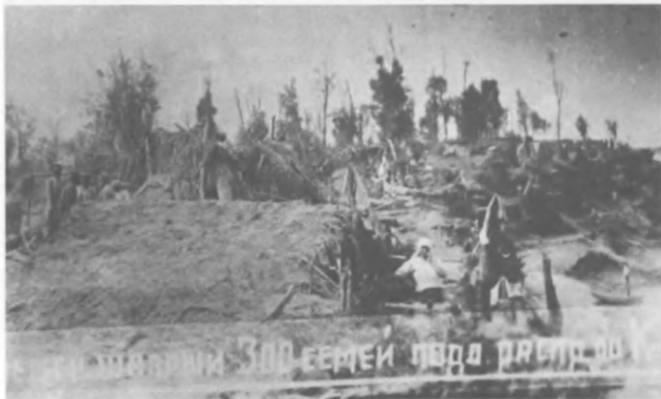
Временные шалаши на 300 семей, подлежащих распределению по спецпоселкам