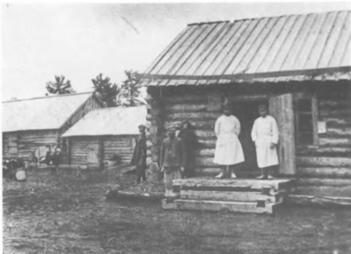
Медицинский пункт в одном из спецпоселков