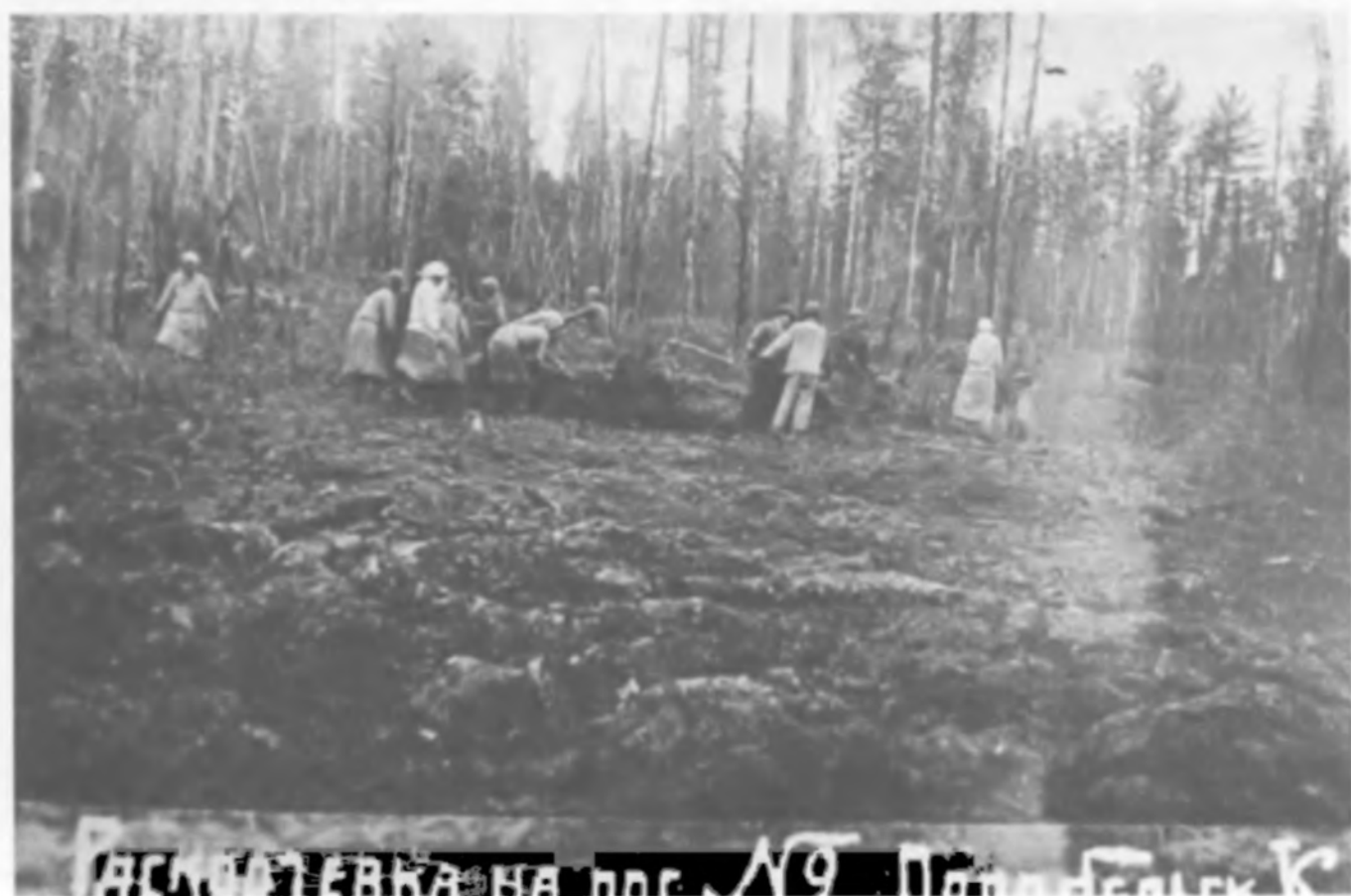
Раскорчевка на пос. № 9 Парабельской комендатуры