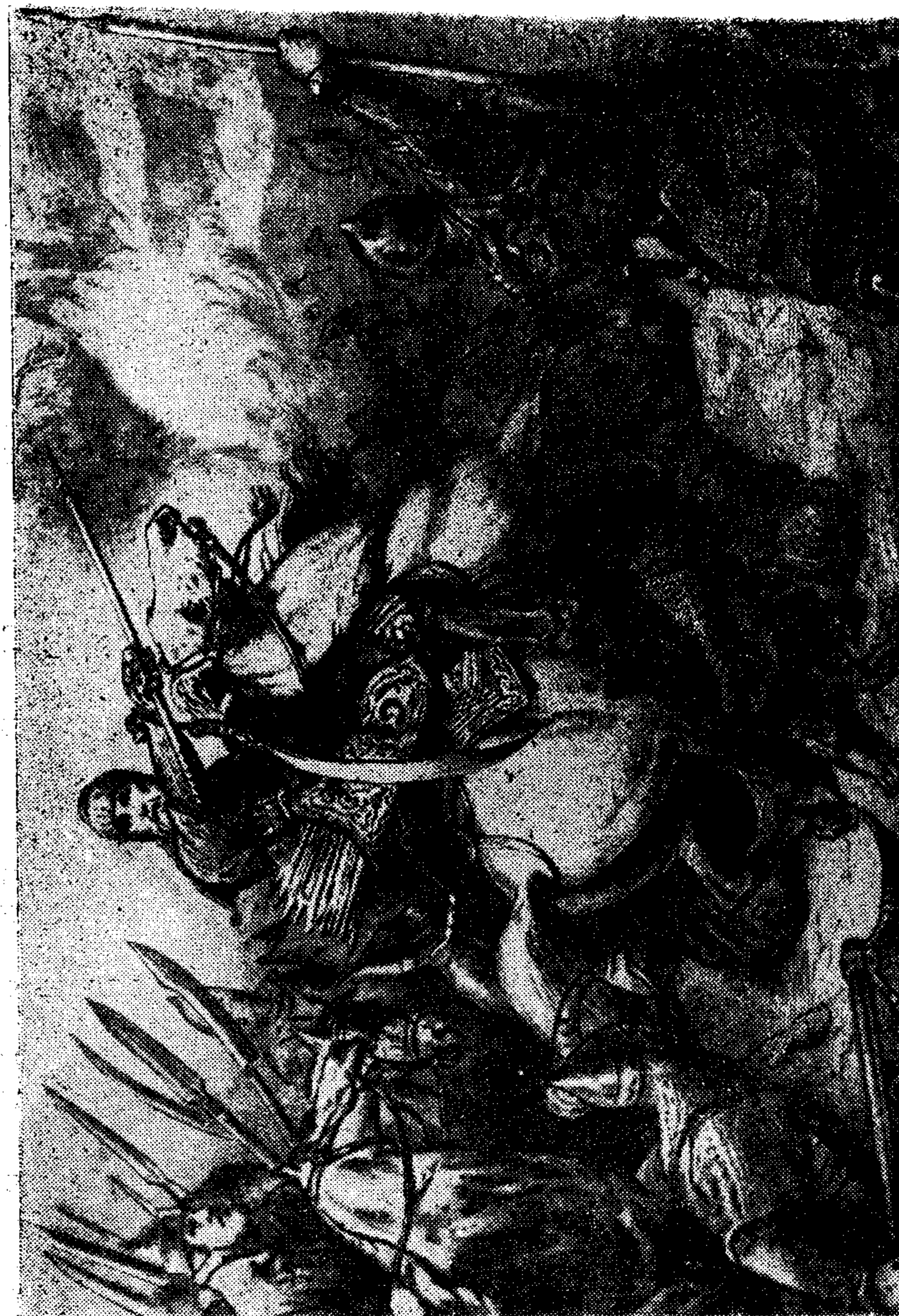
«Ермак. Покоритель Сибиря». Гравюра по рисунку А. Шарлемана.

Дружинники дрались необычайно храбро и упорно. На каждого из них приходилось по нескольку врагов. Есаулы и сотники сражались в первых рядах воинов, воодушевляя их. В самых опасных местах появлялся и Ермак Тимофеевич. Он казался вездесущим. Опытным взором военачальника Ермак замечал место, где казаки начинали отступать, и мчался туда, окруженный несколькими верными друзьями. Его меч, его голос, а больше того, само его присутствие делали чудеса: узнав, что атаман с ними, усталые, израненные люди снова и снова бросались в атаку.