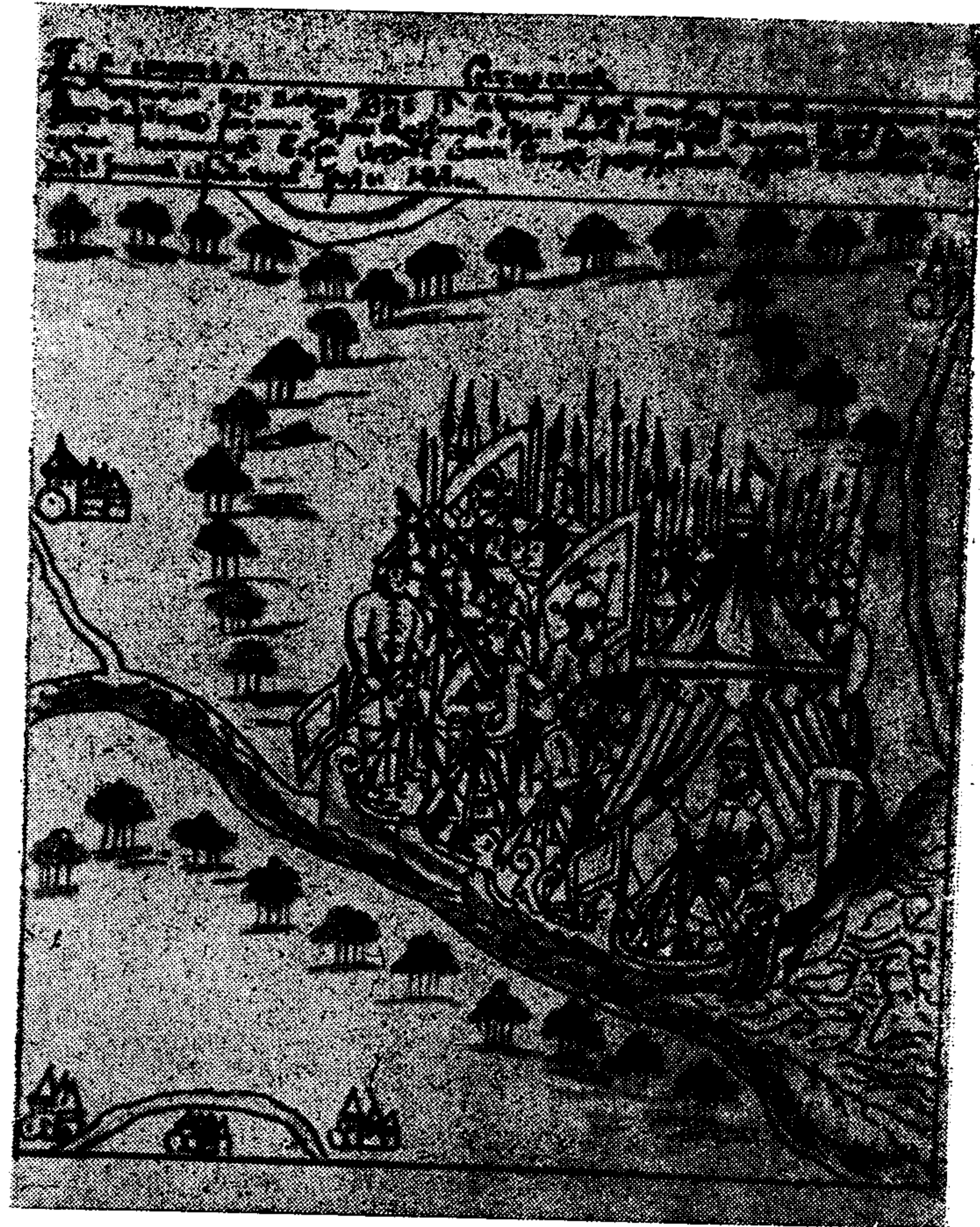
Начало похода Ермака. Иллюстрация из Кунгурской летописи XVII века.

Ермак ввел железную дисциплину в своем войске. За легкие проступки виновных наказывали плетями. Изменников и