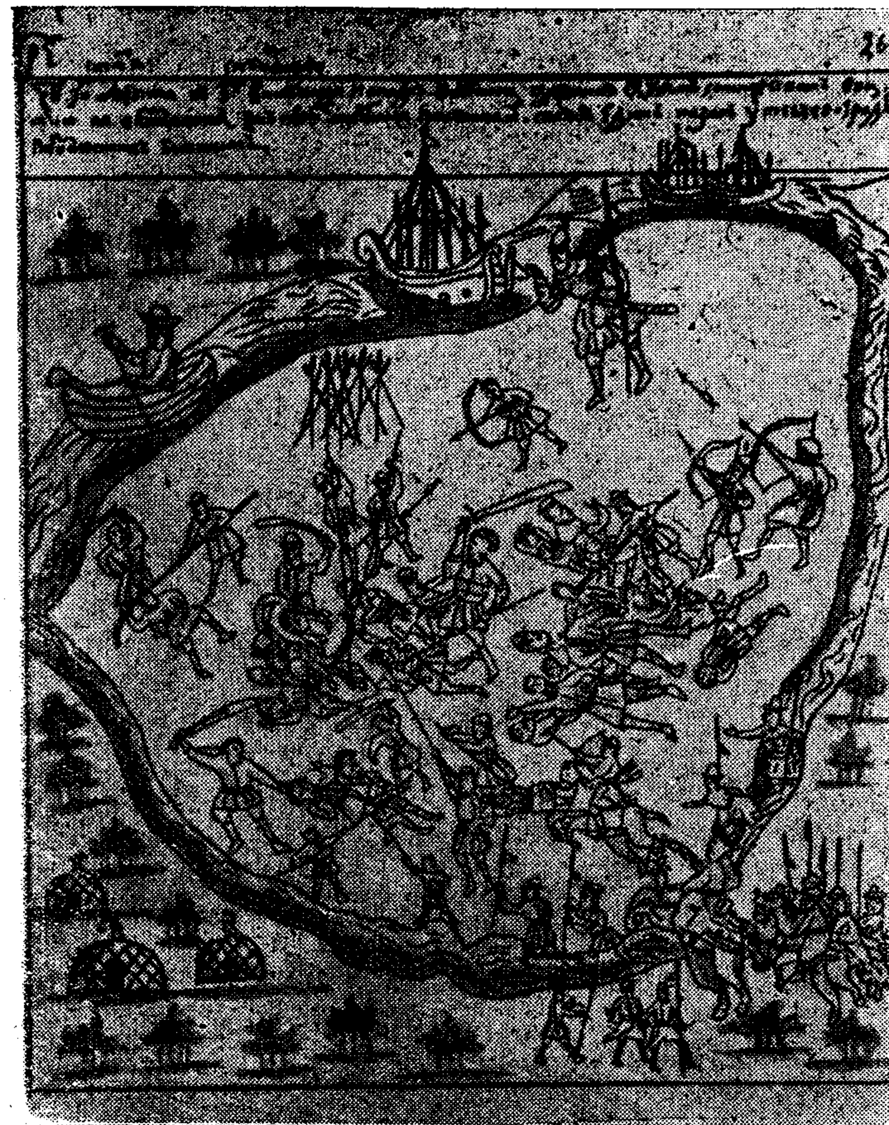
Нападение татарского отряда на воинов Ермака в начале августа 1585 года. Иллюстрация из Кунгурской летописи XVII века.

Вскоре в русском лагере начался страшный голод. Люди съели лошадей и собак. Они варили кожаные ремни и седла, древесную кору, пытаясь заменить этими жалкими суррогатами пищу. Вместе с голодом пришла его верная спутница — цинга, которая косила стрельцов и казаков одного за другим.