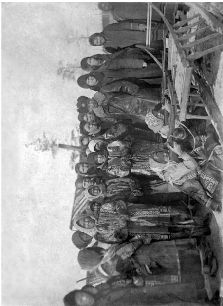
Стрелковые соревнования среди женщин. 1936 год.