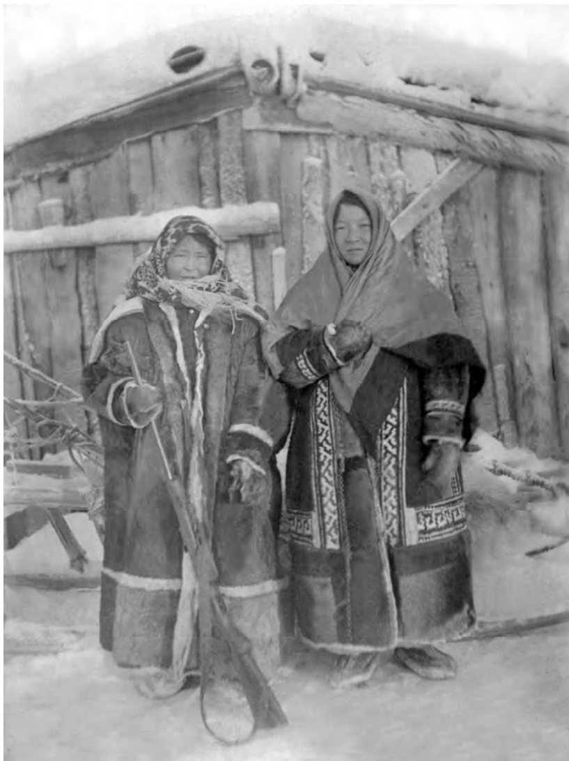
Лучшие стрелки национальной олимпиады. 1939 год.