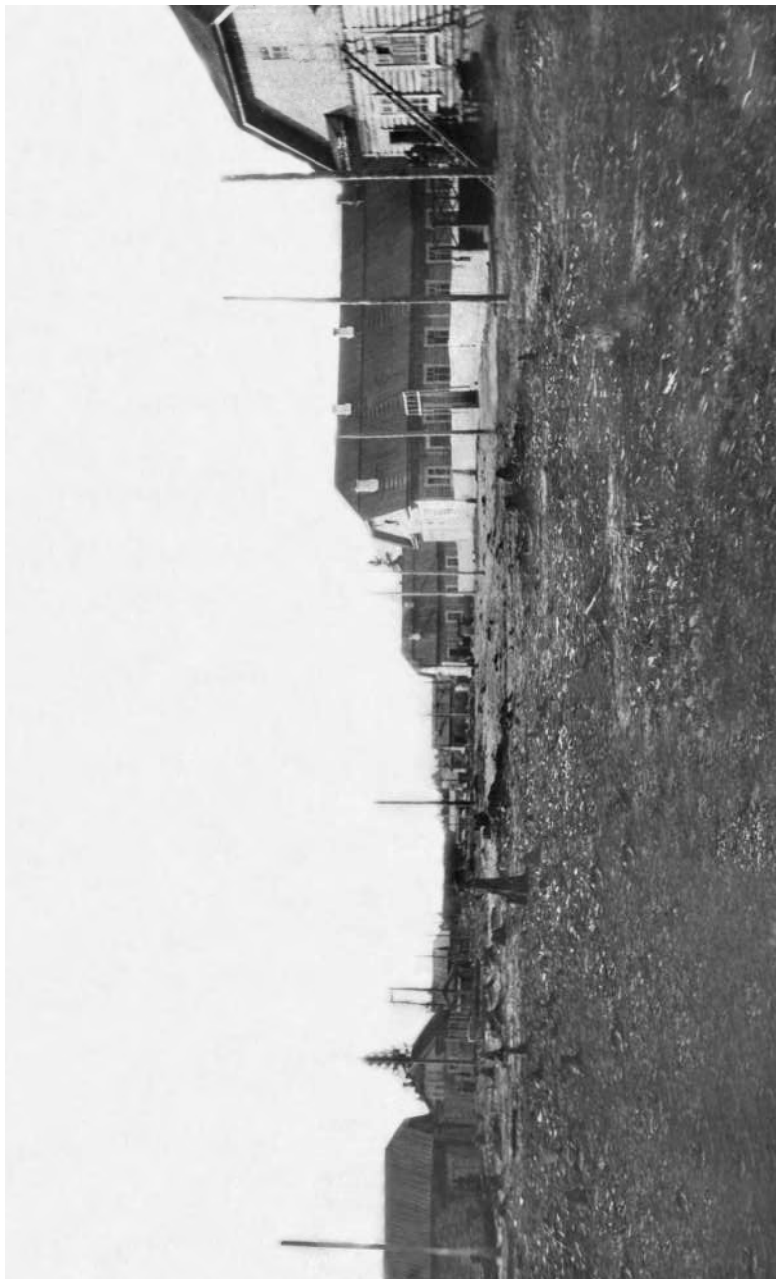
Первая улица Казымской культбазы. 1936 год.