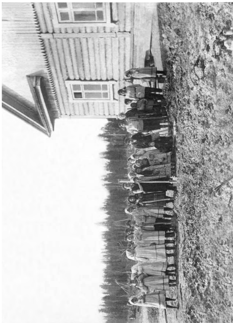
Закладка первого огорода на культбазе. 1934 год.