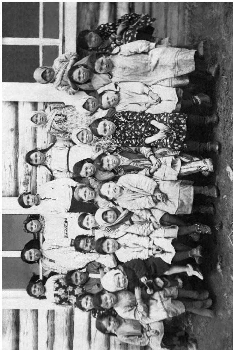
Группа учениц-девочек у здания Казымской школы-интерната. 1936 год.