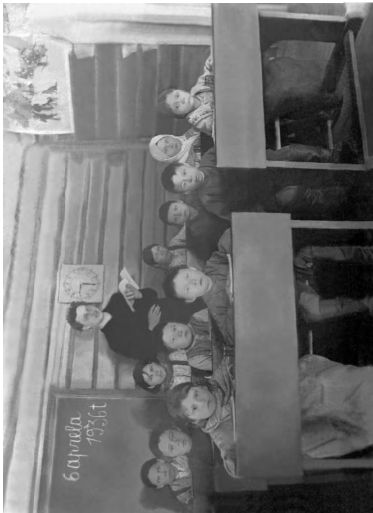
Ученики филиала школы-интерната на уроке с учителем (Юильск). 6 апреля 1936 год.