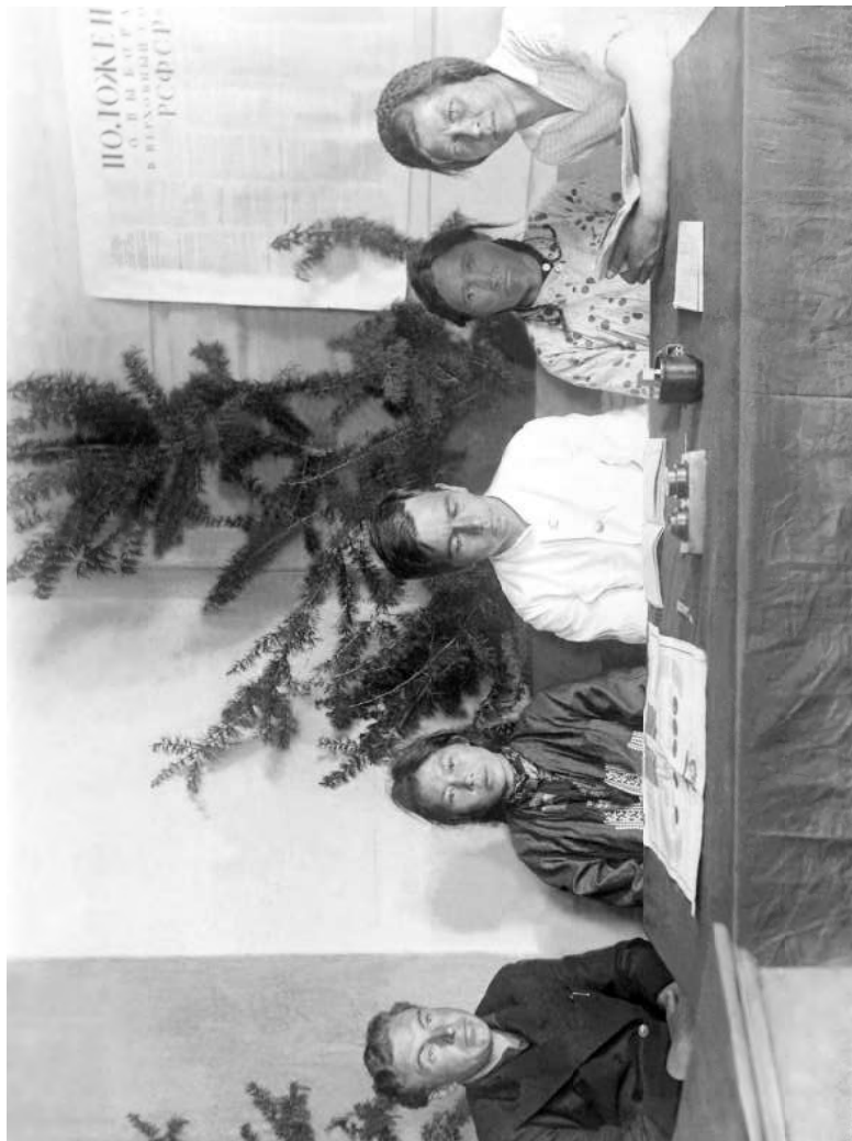
Избирательная комиссия по выборам в Верховный Совет РСФСР. 1938 год.