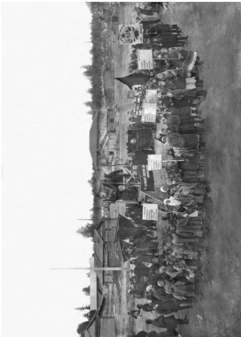
Казымские школьники на первомайской демонстрации. 1936 год.