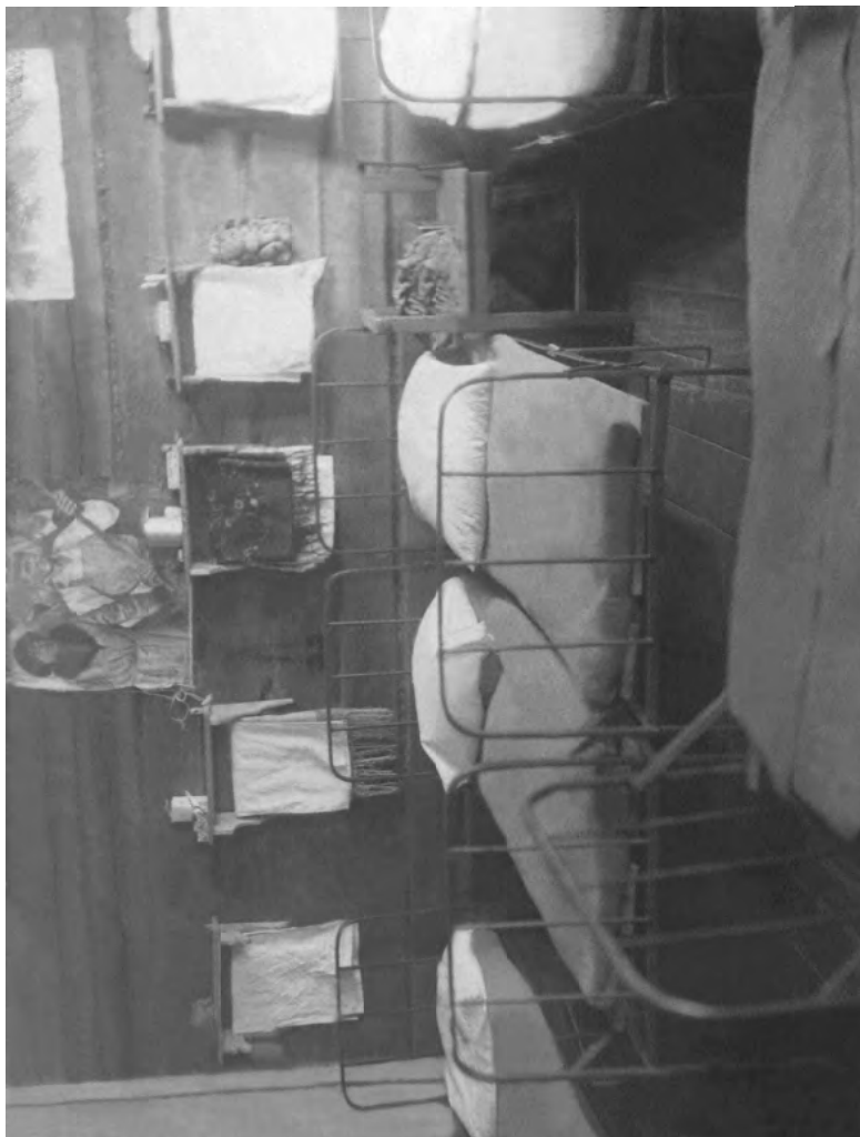
Спальная комната школы-интерната. 1936 год.