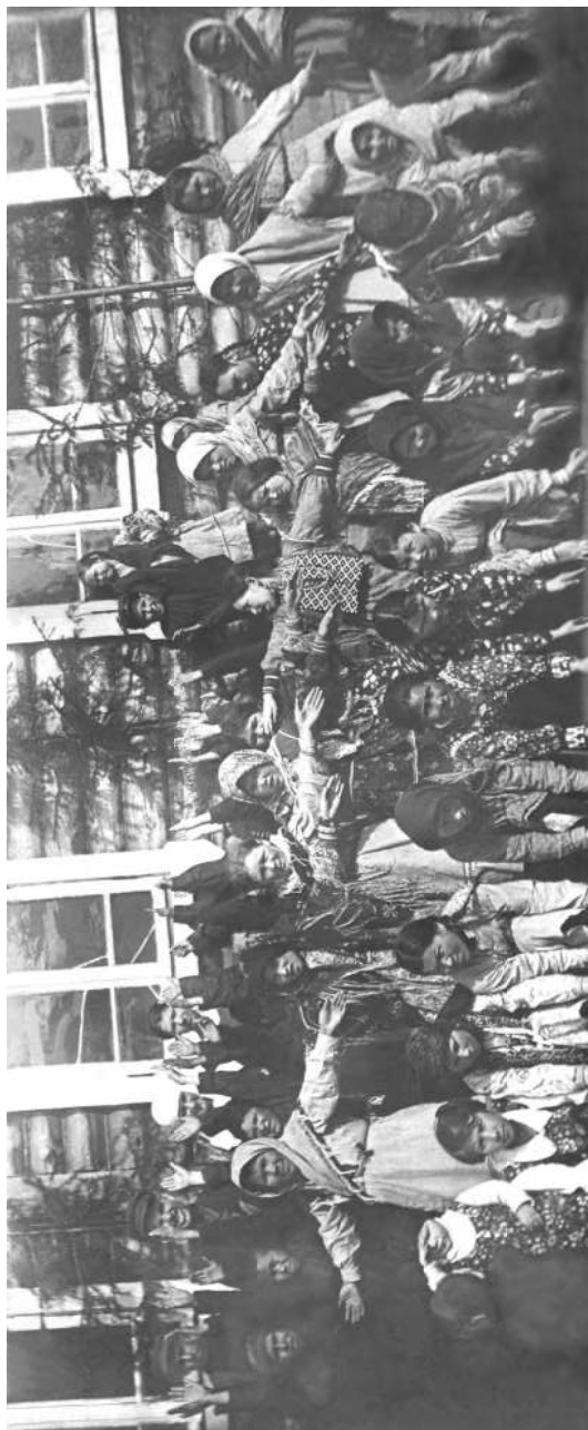
На школьном празднике. Фото А. Н. Лоскутова. 1934 год.