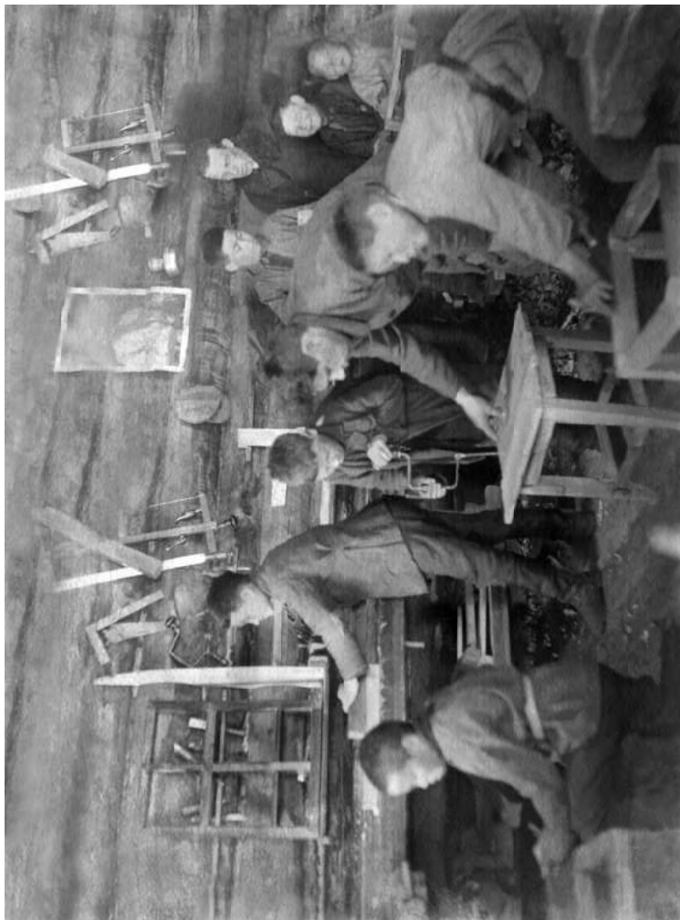
Учащиеся школы-интерната в столярной мастерской на уроке трудового обучения. 1936 год.