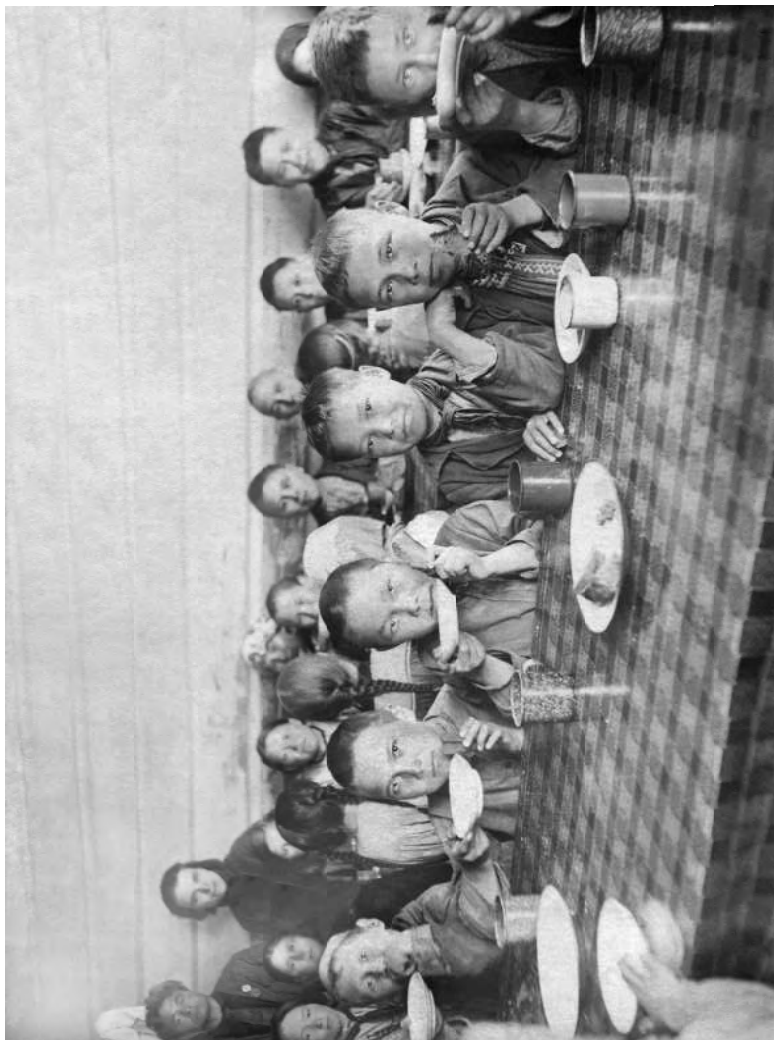
Столовая Казьмской школы-интерната. Фото А. Н. Лоскутова. Фото А. Н. Лоскутова. 1936 год.