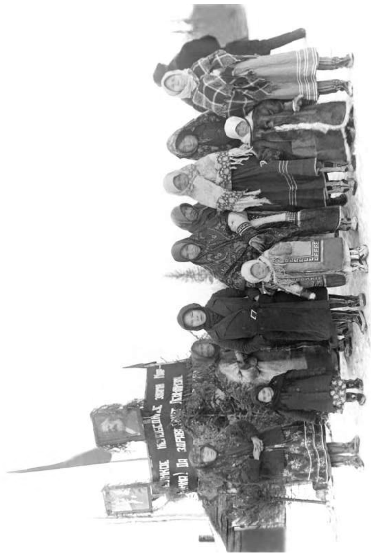
Празднование 1 Мая. В центре - группа гостей из соседних юрт. 1939 год.