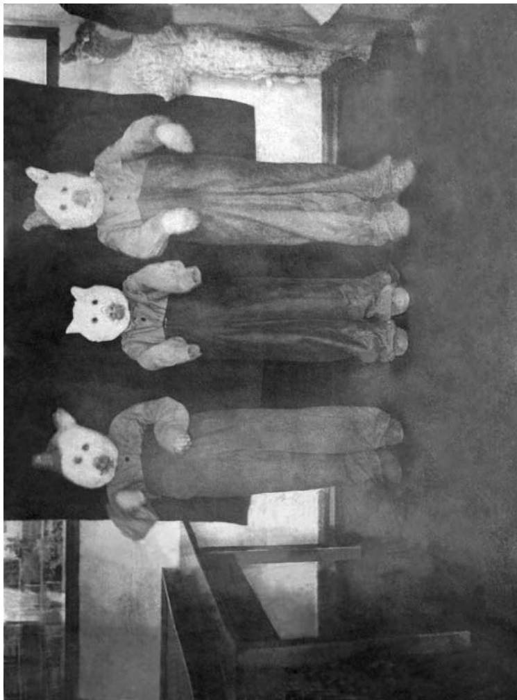
Инсценировка сказки «Три поросенка» актерами драмкружка Казымской школы-интерната. 1936 год.