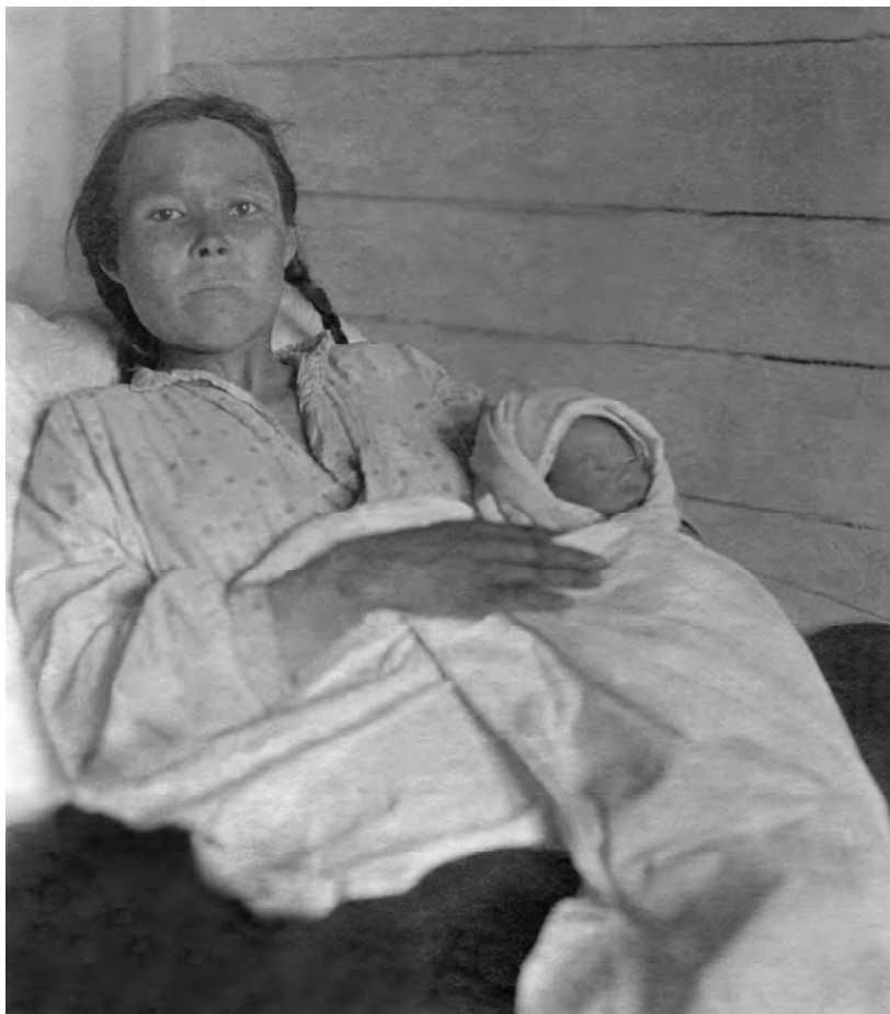
Одна из первых родильниц в роддоме больницы Казымской культбазы. 1936 год.