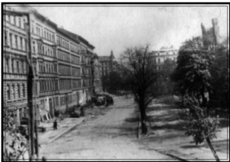
Берлин, затишье между боями. Апрель, 1945 г. Автор А.К. Суханов