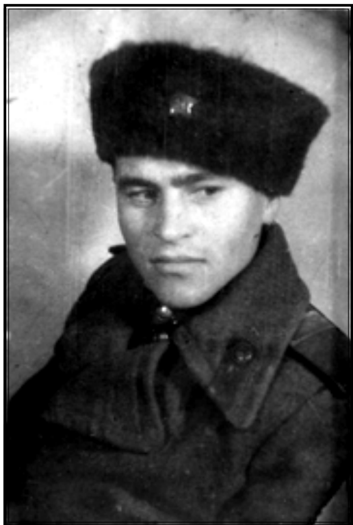
Военный фотограф А.К. Суханов. [1944 г.]. Автор неизвестен