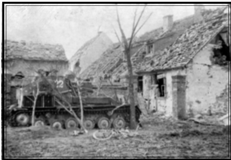
Бой за пригород г. Берлина. Самоходная артиллерийская установка САУ-76. Апрель 1945 г.