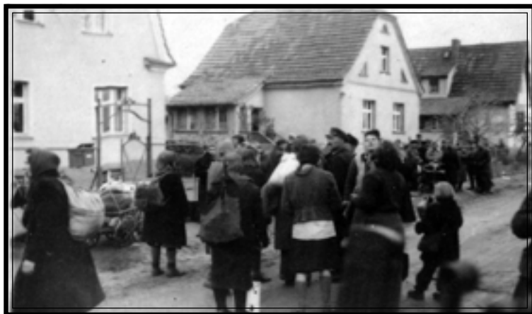
Польские граждане, угнанные на работу в Германию, перед отправкой на родину. Германия, пригород г. Берлина, апрель 1945 г.