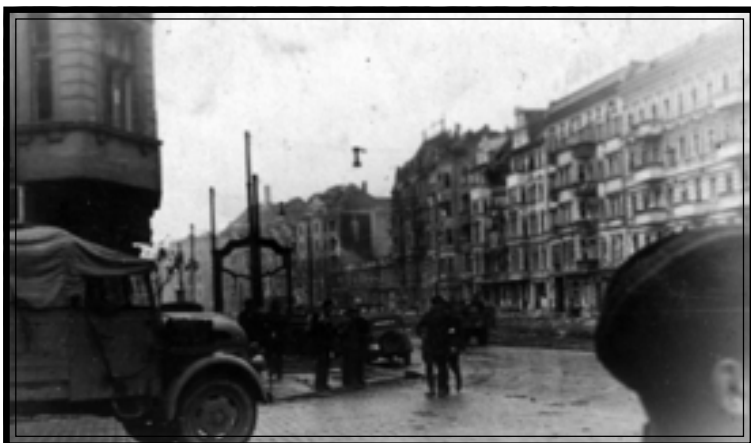
Советские войска на улицах Берлина. Апрель 1945 г. Автор А.К. Суханов