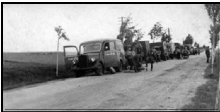
Автоколонна советских войск в Германии. [1945 г.] Автор А.К. Суханов