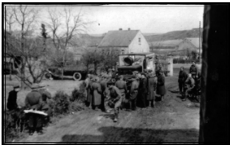
Общевойсковая звуковещательная станция в подразделении советских войск в районе р. Одер. Германия, апрель 1945 г. Автор А.К. Суханов.