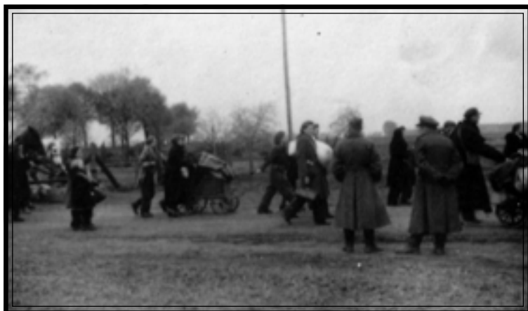
Возвращение на родину польских граждан, угнанных на работу в Германию. Германия, пригород г. Берлина, апрель 1945 г.