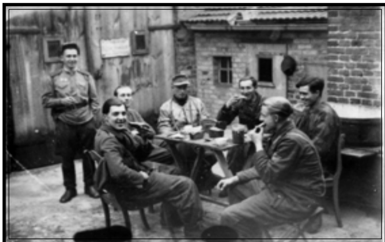
Пленные немецкие солдаты за обедом. Германия, апрель 1945 г.