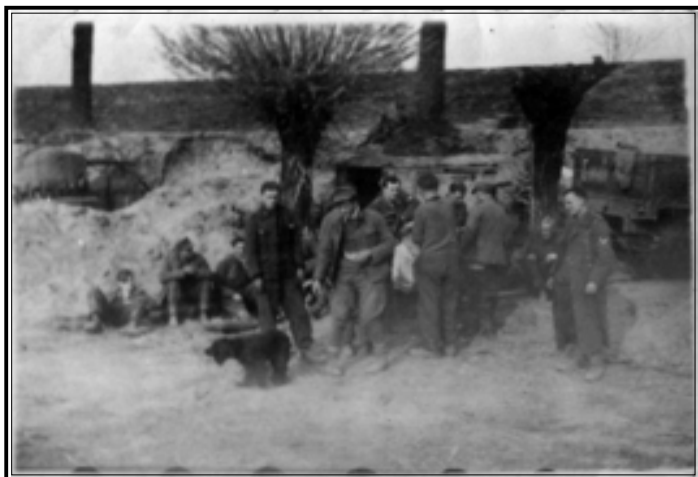
Пленные немецкие солдаты в районе р. Одер. Германия, март-апрель 1945 г.