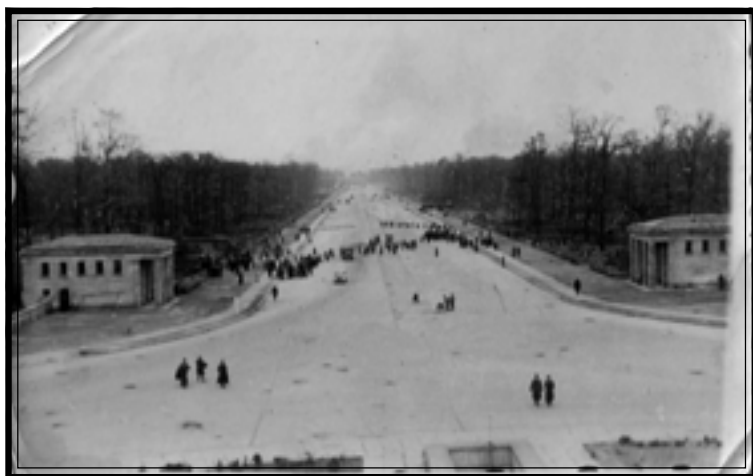
Вид на Бранденбургские ворота. Берлин, Тиргартенштрассе, 5 мая 1945 г.