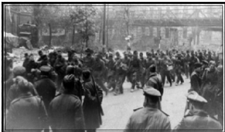
Колонна немецких военнопленных.

Германия, [май 1945 г.]