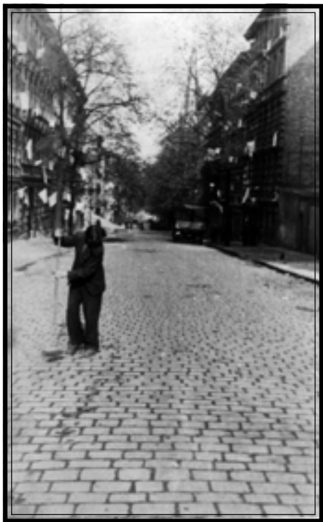
Белые флаги в окнах домов капитулировавшего Берлина. 1945 г. Автор А.К. Суханов