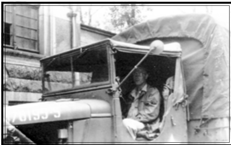
Американский солдат-водитель. Германия, г. Райхенбах, июль 1945 г. Автор А.К. Суханов