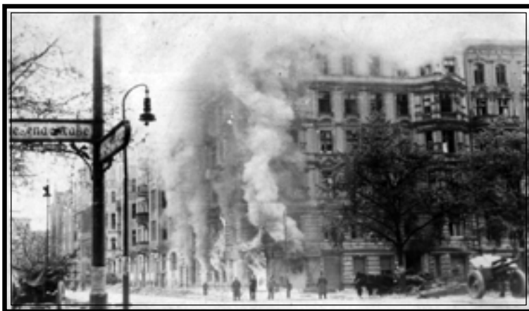
Бой на Эйзенахерштрассе. Справа – гаубица калибра 112 мм. Берлин, 26 апреля 1945 г. Автор А.К. Суханов