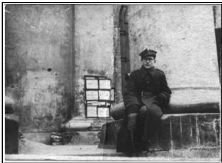
Польский солдат. Польша, Люблин, декабрь 1944 г.