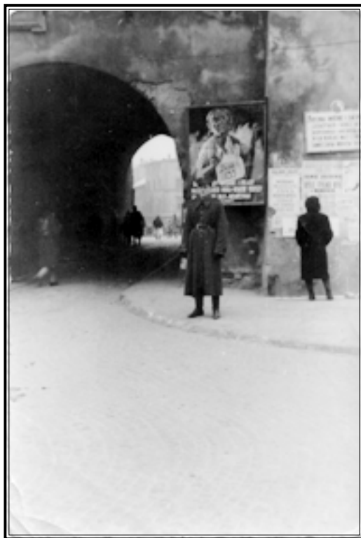
Польский солдат на улице освобожденного советскими войсками г. Люблина. Польша, декабрь 1944 г.