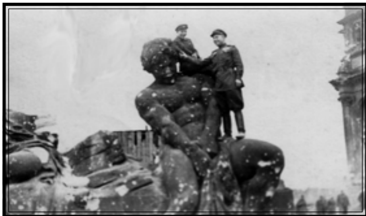
Советские солдаты у стен рейхстага.