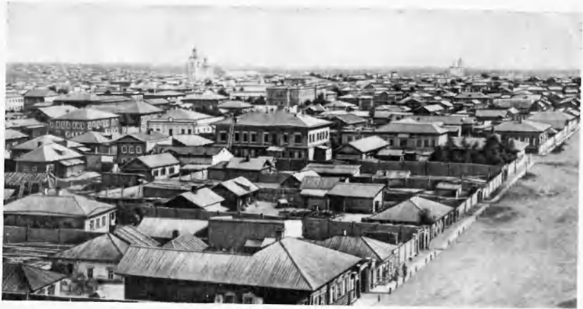
Красноярск. Конец XIX в.