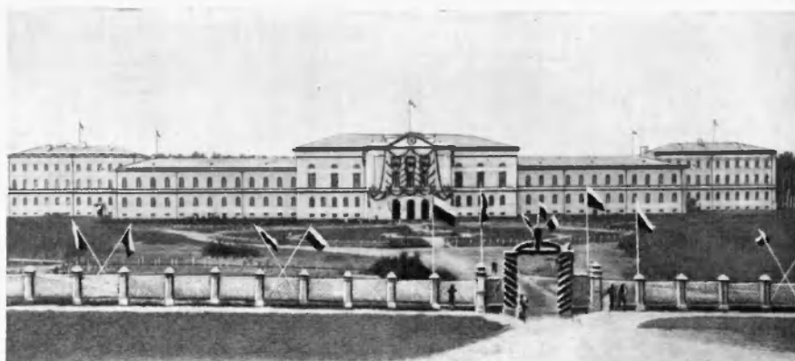
Томский университет в день открытия. (Первый университет в Сибири. Томск, 1888).