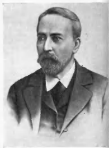
Б. И. Дибичский.