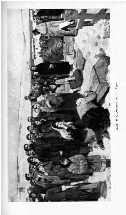
Азия. 1912. Хыомонс Ю. Н. Туан.