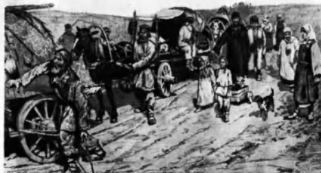
Переселенцы. Автография В. И. Иванова, 1885.

По социальному составу большинство переселенцев относилось к середнякам. У себя на родине они стояли на грани перехода в группу бедноты,