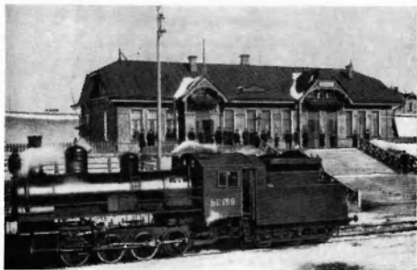
Поезд в Новониколаевске. Начало XX в.

Кроме указанных выше английских предприятий в горном деле Сибири, многие иностранцы получили право на промышленную разработку полезных ископаемых, большинство из них вело минимальную добычу, чтобы не потерять право на месторождение. Однако до 1907 г. иностранный капитал не играл сколько-нибудь заметной роли в горном деле Сибири. Созданные в этот период иностранные горнопромышленные компании действовали, как правило, на основе уставов своей страны и лишь на определенных условиях допускались к операциям в России. Они представляли чужеродный элемент в экономическом организме края. Правле-