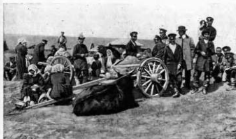
Якуты на ярмарке.

Монополии, закабаление путем ростовщического кредитования — таковы были «несложные начала», на которых основывалась торговля с народами Сибири. Пользуясь острой нуждой охотников, рыбаков, скотоводов, купцы давали в долг под высокие проценты товары и деньги. При неуплате в срок, преимущественно натурой, проценты повышались. В результате должники попадали в кабалу к купцам, были вынуждены за бесценок сдавать им пушнину, рыбу, скот и пр., становились по существу кабальными работниками кредиторов.