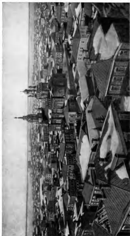
Тбилиси. Конспект XIX в. (Анатолийский Период, т. I. С. 116., 1914).