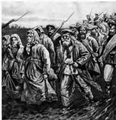
В дороге. На каторгу. («Живописная Россия», т. XII, ч. I, СПб., 1895).

В дореформенные времена осужденных на каторгу отправляли в Сибирь непосредственно для работ на казенных и кабинетских заводах и