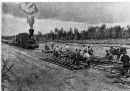
На постройке Сибирской железной дороги. (Большой путь, пм. I. Красноярск, 1899).

Проблема обеспечения строительства Сибирской магистрали рабочей силой была наиболее трудной, и решалась она типичным для капитализма путем: безработица, нужда, аграрное перенаселение в Европейской России создавали постоянную резервную армию труда, за счет которой и шло непрерывное пополнение рабочей силы на строительстве дороги.