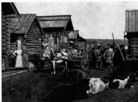
Улица в старокиргизской деревне Чаме Иркутской губернии. (Азиатская Россия, т. 1, СПб., 1914).

Наличие в Сибири большой прослойки беспосенных и малопосенных хозяйств, безлошадных и однолошадных дворов показывает, что здесь не было общей высокой зажиточности крестьянства. Сравнительно большая обеспеченность сибирского крестьянства возникла за счет зажиточности кулацкой верхушки и дальнейшего разорения бедняцкой группы. Сибирское кулачество было более мощным, чем кулачество в центре страны. Так, в 1912 г. в Сибири было 50% хозяйств, имеющих 4 и более лошадей, а в европейской части страны — только 10%. В Сибири было 5% хозяйств, каждое из которых имело 10 и более лошадей. Это были крупно-