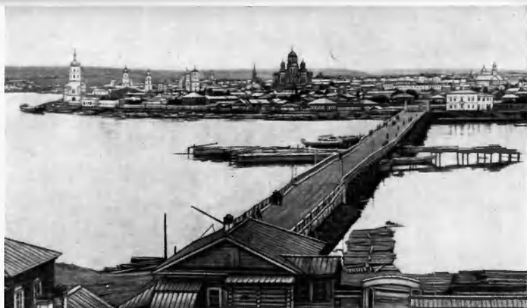
Иркутск. Начало XX в. (П. Голосовцев. Собр. М., 1902).