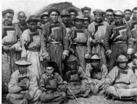
Группа рабочих бурят на постройке Забайкальской железной дороги.

Непроходимая тайга, горы, болота, трескучие морозы зимой, зной и гнус летом превращали процесс труда в каждодневную и изнурительную