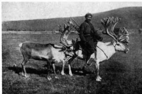
Тувинец-охотник. (Из коллекции П. П. Хороших. Иркутск).

В западной и центральной части Тувы были распространены такие виды ремесла, как кузнечное, литейное, столярное, шорное, катание войлоков, портняжное, сапожное. Ремесло сочеталось с домашними промыслами.