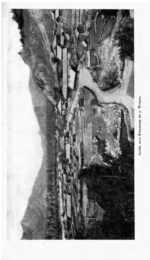
Алтай, село Вязовоар км р. Катунь.