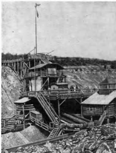
Машина для промывки золота. (П. Головачев. Сибирь, М., 1902).

Сибирское золото составляло основу золотого запаса России. Из 2207 пуд. золота, добытого в стране в 1882 г., на долю Сибири при-