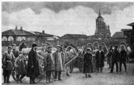
Якутск. Уличная сценка.

Распространенной формой эксплуатации у алтайцев и других скотоводов была отдача скота на выпас за приплод и отработки. Бедняк, получивший корову, был обязан за пользование молоком кормить ее, сохранить приплод и возвратить его баю. Кроме того, он должен был за