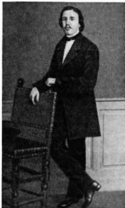
Н. А. Серие-Соловьевич — русский революционер-демократ. (Русско-польские революционные связи. Материалы и документы, т. II, М., 1963, стр. 537).

Из вилюйского заточения Чернышевский был освобожден только в августе 1883 г. 24 августа он выехал из Вилюйска в сопровождении жандармов. Его везли секретным порядком, стремясь изолировать от общения даже с близкими знакомыми.