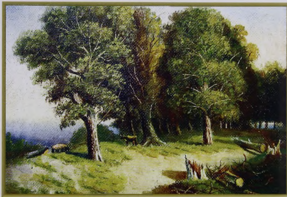
Кедровый лес (масло, ДВП)