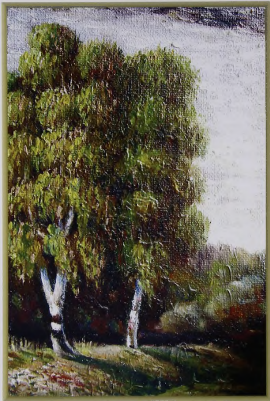
Перед дождем (масло, ДВП)