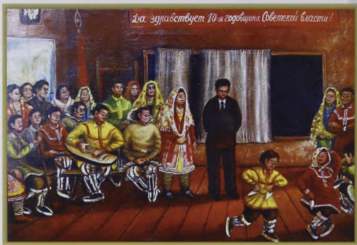
10-я годовщина Советской власти на Обском Севере (масло, холст)