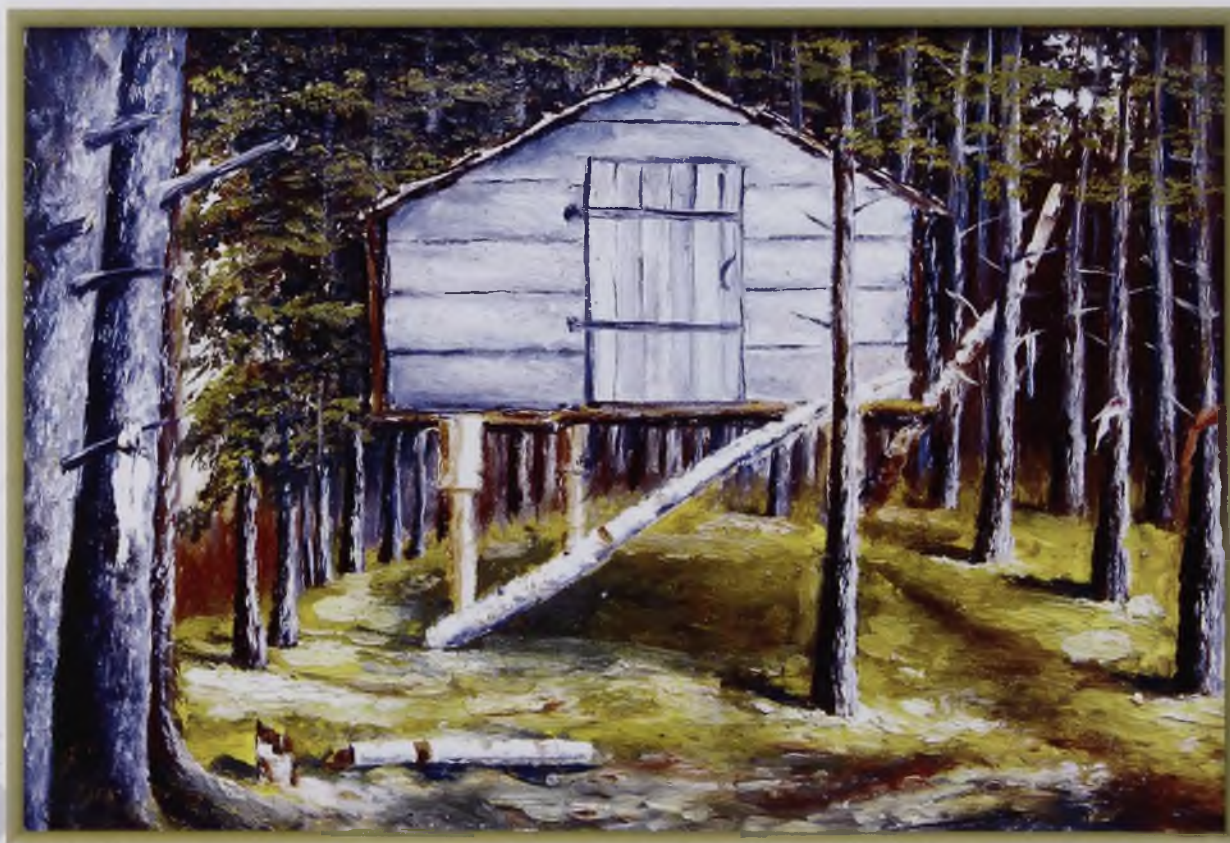
Священное место (масло, холст)

Долго стоял Лев Давыдович у шумного переката, очарованный этим чудным уголком дикой природы. Именно в эти минуты он ощутил весь ужас братоубийственных событий на Красной Пресне в декабре 1905 года, когда в грохоте выстрелов совершалось чудовищное кровопролитие. Какое зло творят себе люди и какое умиротворение царит в природе! Троцкий впервые ощутил всю пагубность человеческого зла и доброту философии незримо мыслящей природы. Видимо, прав был великий Жан Жак Руссо, когда звал людей “назад в природу”.