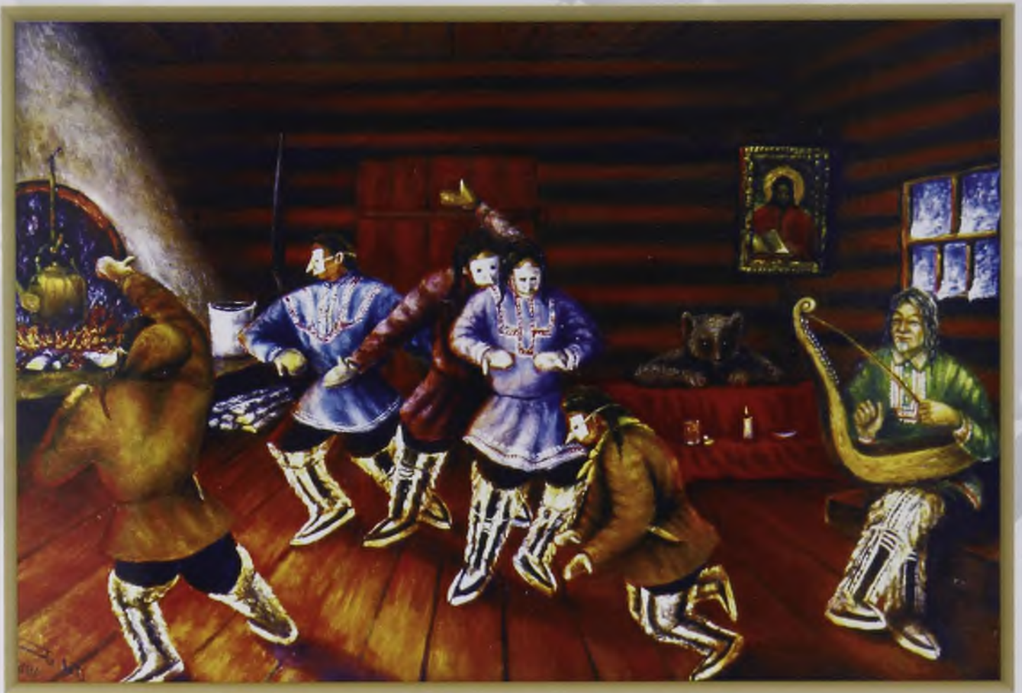
Медвежий праздник (масло, холст)

Манси – вольные вогулы Полюбили сули-водку. И за пазухою носят На охоту и рыбалку Флягу с огненным настоем, С жидким пламенем бутылку.