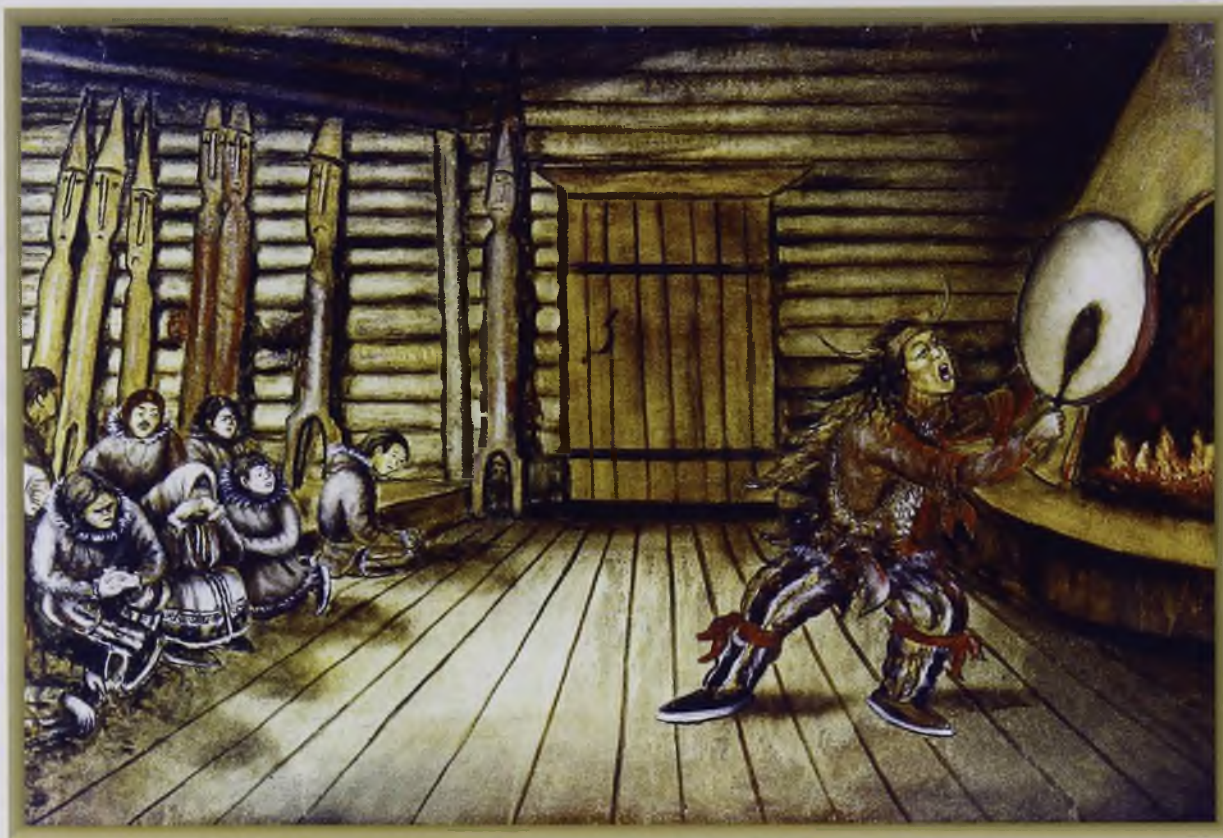
Шаман (масло, холст)

Он долго смешивал одни травы с другими, что-то нашептывал, ссылая их в две большие железные кружки. Оставшиеся смеси трав шаман завязал в отдельные тряпочки и положил их за пазуху своего старенького совика. Затем он сел возле очага, поджав под себя ноги, уперся взглядом в горящие угли чувала и, отрешенный от всего, просидел так не менее часа.