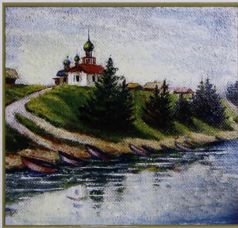
Монастырь (масло, ДВП)

Миссионеры Кондинского монастыря, да и священнослужители Матлымской, Шеркальской и Чемашинской церквей, понимали, что идолопоклонство постепенно теряет свое былое значение и заменяется двоеверием.