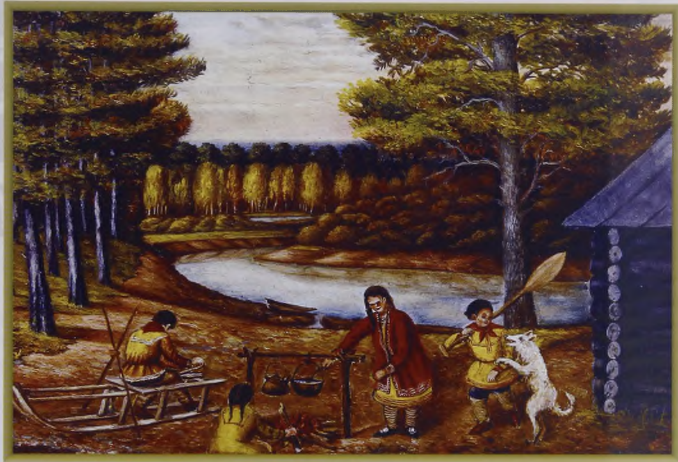
Аборигены древнего Казыма, 1987 (масло, холст)

роста, с походкой человека, долгое время служившего в кавалерии. Взгляд его серых глаз был умным и проницательным. Хотя он был из рабочих, но по внешнему виду был похож на сибирского старообрядца.