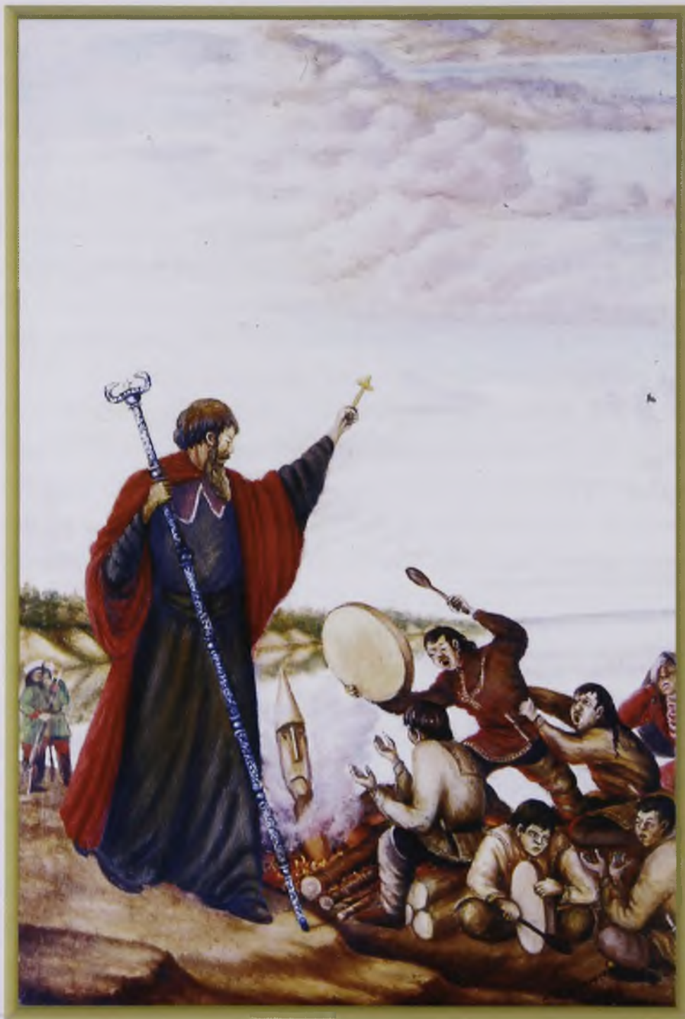
Крушение лесных духов (масло, холст)

здесь увидел толпы инородцев, заранее собранных к услышанию проповеди и принятию святого крещения. Река Сосьва делалась купелью множества остяков и людей обдорского князька Тайшина. Филофей оставил после крещения одного из бывших с ним священников для распространения и утверждения христианства, сам же возвратился в Тюмень, на пути поучая новых христиан новой вере, и правилам благочестивой жизни».