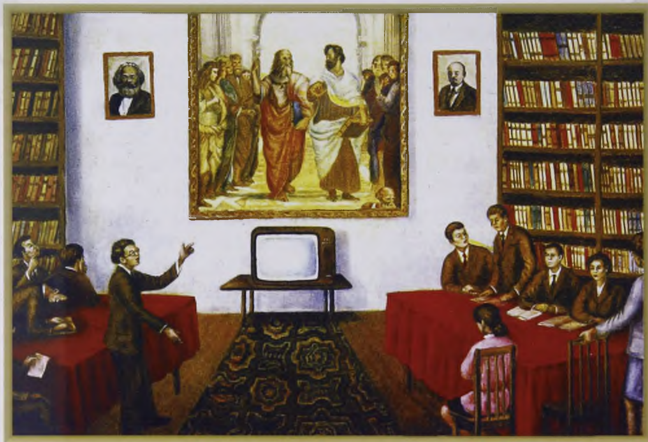
Оппоненты Платона. Третья часть триптиха «Разум и вера», 1988 (масло, холст)