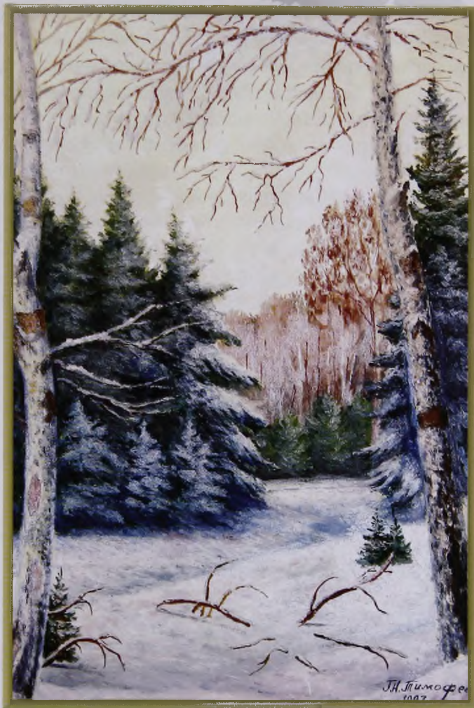
Солнечный день, 1997 (масло, ДВП)