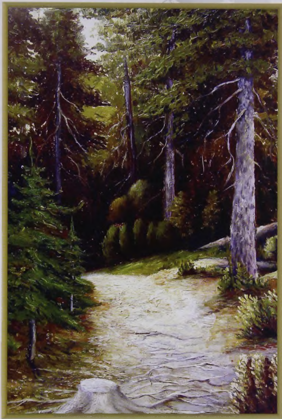
Тропинка (масло, ДВП)