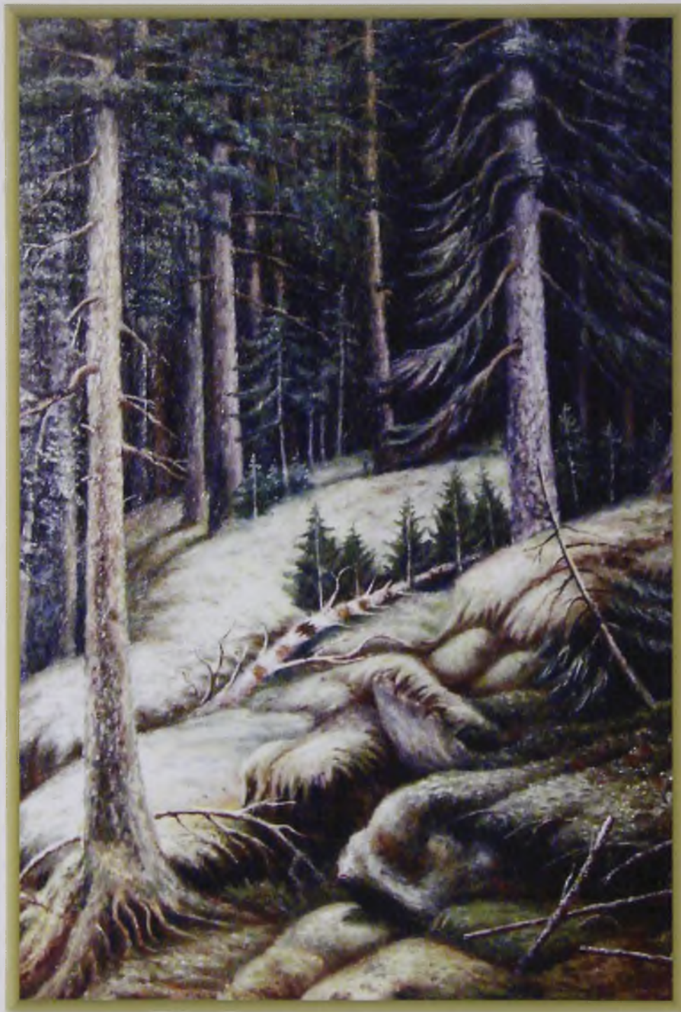
Пейзаж возле п. Октябрьское, 1997 (масло, ДВП)