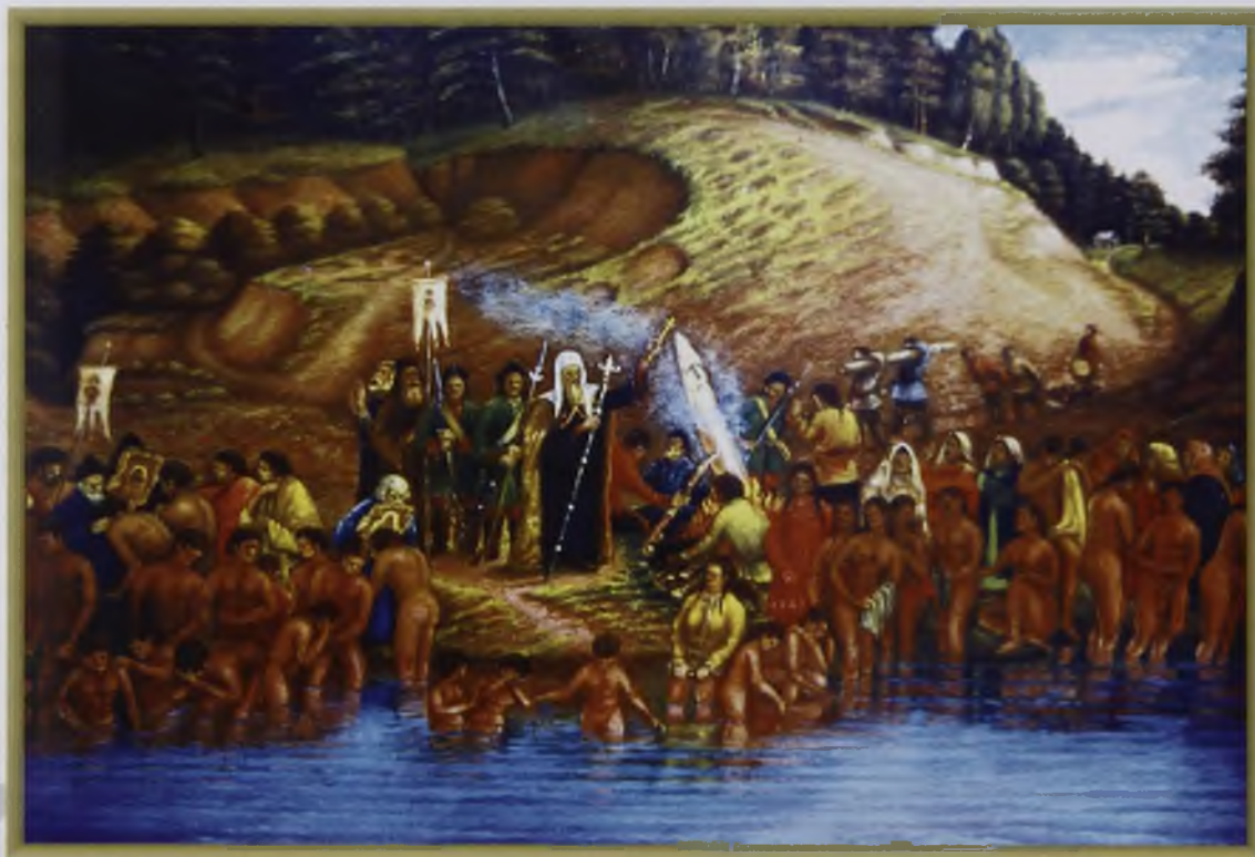
Крещение остяков (Стефан Пермский) (масло, холст)

Кондинский Свято-Троицкий храм стал не только религиозным центром на среднем течении Оби, его церковные престолы не только "образовали в Кодском городке государево моление", высочайше было велено "... чтоб ведя православие остяков крестить". Монастырь стал центром православной миссии на всем Обском Севере.