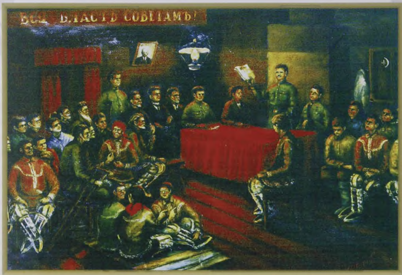
Провозглашение Советской власти (масло, холст)

В некоторых ревкомах, в частности в Кондинском (ныне Октябрьский район) их руководители в условиях военного положения не смогли установить контроль над обстановкой. Часть членов ревкомов при поддержке уголовных элементов занялись грабежом, мародерством и двурушничеством.