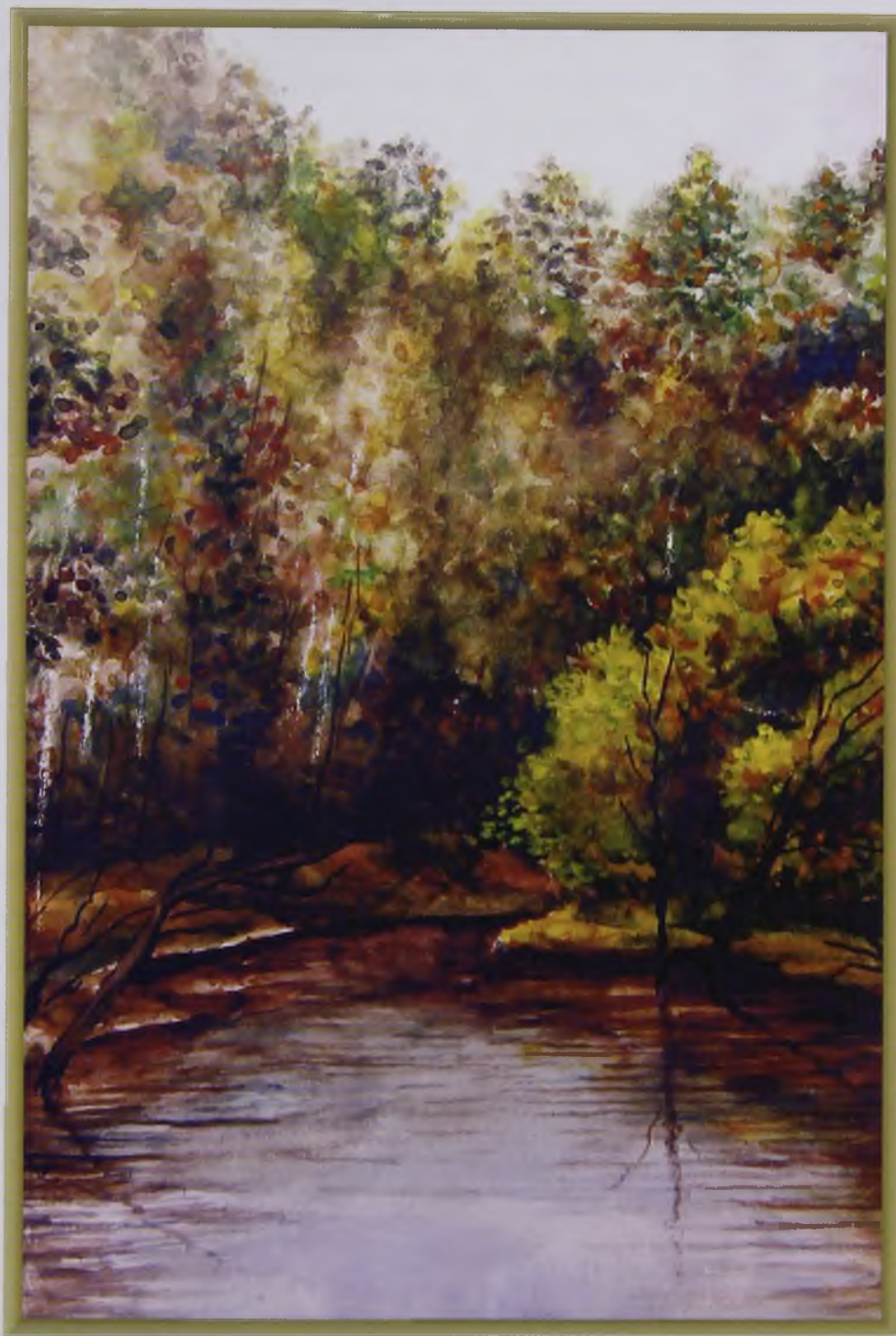
Осень (акварель, картон)