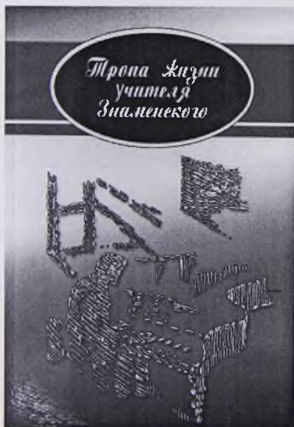
Книга, изданная к 110-летию со дня рождения сургутского учителя Аркадия Степановича Знаменского