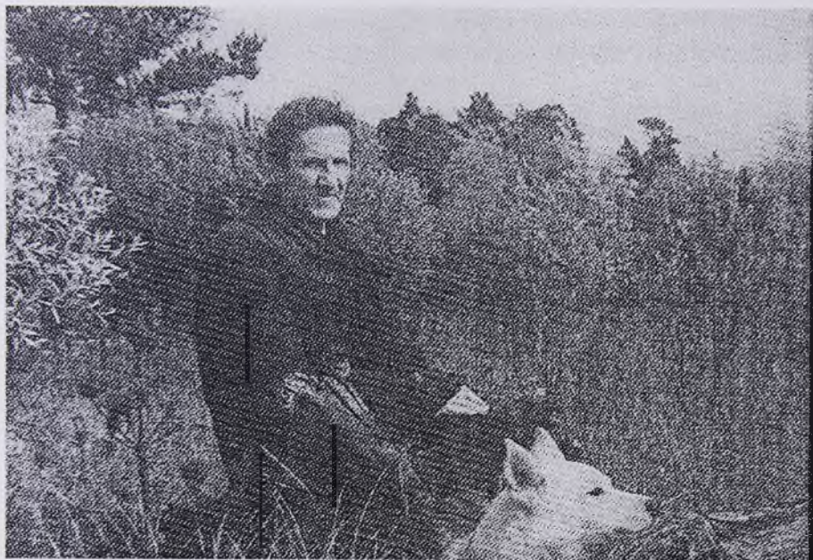
А.С. Знаменский. Иллюстрация из книги