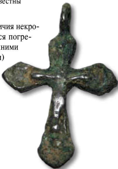
Ил. 4. Нательный крест из погребения, найденного возле Никольской часовни.

Фактическим подтверждением наличия некрополя на территории часовни являются погребения, которые были найдены нынешними владельцами дома (бывшей часовни) при земляных хозяйственных работах. Со слов очевидцев, могилы находились на южной и восточной сторонах участка, прилегающего к постройке, а также в подполье под домом. Специалистам, к сожалению, удалось ознакомиться только с фотоматериалами, так как все останки были перезахоронены или выброшены. Также со слов известно, что все погребения залегали на глубине более 1,5 м. Были обнаружены фрагменты деревянных дощатых гробов (частично, возможно, ко-