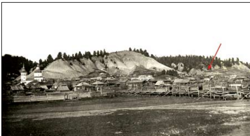
Ил. 10. С. Самарово (справа, под красной стрелкой — кладбище). 1909 г.