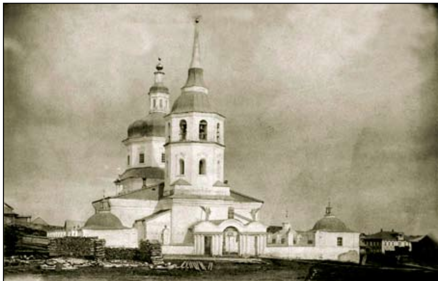
Ил. 5. С. Самарово, церковь Покрова Пресвятой Богородицы. 1906 г.

Храм был поставлен в центре села, у подножия горы, названной позже Комиссарской. Здание обнесли каменной оградой, внутри которой,