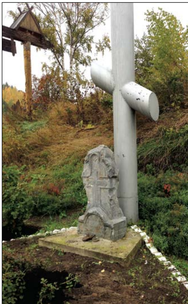
Ил. 8. Каменное надгробие, найденное при восстановлении церкви Покрова Пресвятой Богородицы. 2013 г.

как пишет Х.М. Лопарев, обосновали кладбище «преимущественно для лиц богатых» 11 . Х.М. Лопареву удалось переписать читаемые надписи на надгробиях, по которым устанавливается определённый хронологический промежуток функционирования этого некрополя, — 1840—1889 гг. 12 Верхняя граница — 1889 г. — не окончательная, так как сведения переписывались Хрисанфом Мефодиевичем перед выходом книги (1-е издание вышло в свет в 1896 г.). Кладбище могло функционировать, как минимум, до установления советской власти в с. Самаровском.