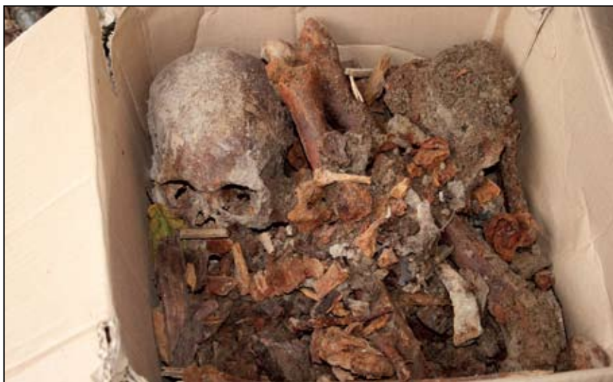
Ил. 3. Остатки погребения (фрагменты костяка и гроба), найденного возле Никольской часовни.

Фактическим подтверждением наличия некрополя на территории часовни являются погребения, которые были найдены нынешними владельцами дома (бывшей часовни) при земляных хозяйственных работах. Со слов очевидцев, могилы находились на южной и восточной сторонах участка, прилегающего к постройке, а также в подполье под домом. Специалистам, к сожалению, удалось ознакомиться только с фотоматериалами, так как все останки были перезахоронены или выброшены. Также со слов известно, что все погребения залегали на глубине более 1,5 м. Были обнаружены фрагменты деревянных дощатых гробов (частично, возможно, ко-