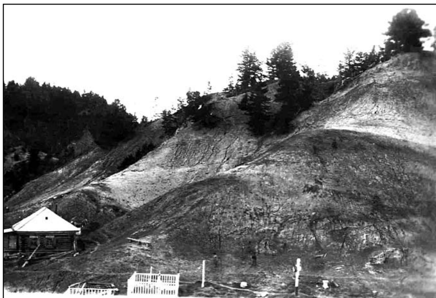
Ил. 7. Кладбище возле церкви на окраине с. Самарова. Вид с юго-востока. 1909 г.