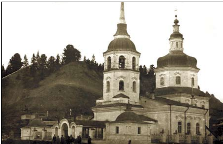
Ил. 6. С. Самарово, церковь Покрова Пресвятой Богородицы (слева — кладбище). 1906 г.