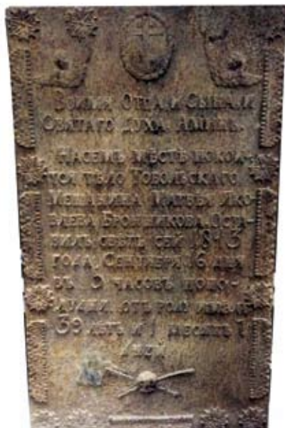
Ил. 9. Надгробная металлическая плита, найденная в районе рыбзавода в Самарове. 2014 г.

«верховского» кладбища соответствует и вышеуказанному плану, и рассказам самаровских старожилов.