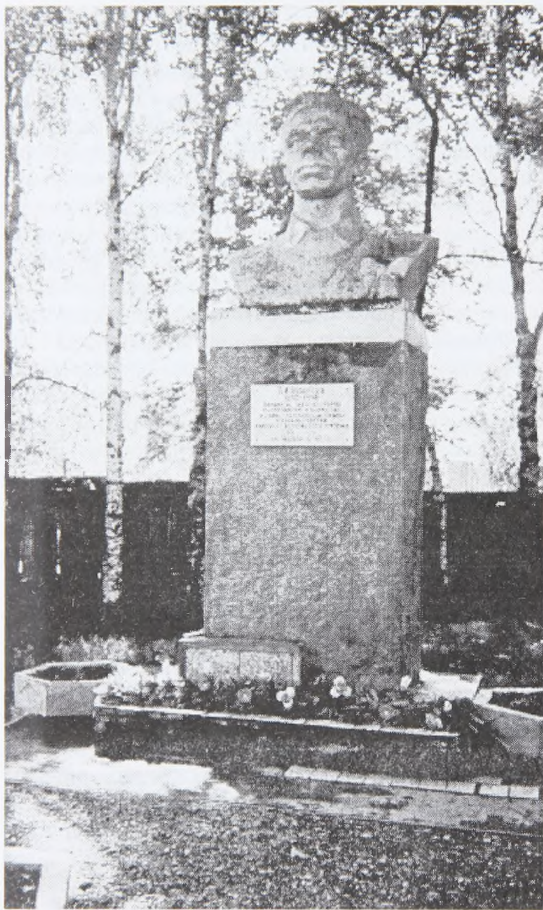
Памятник П.И. Лопареву в г. Ханты-Мансийске