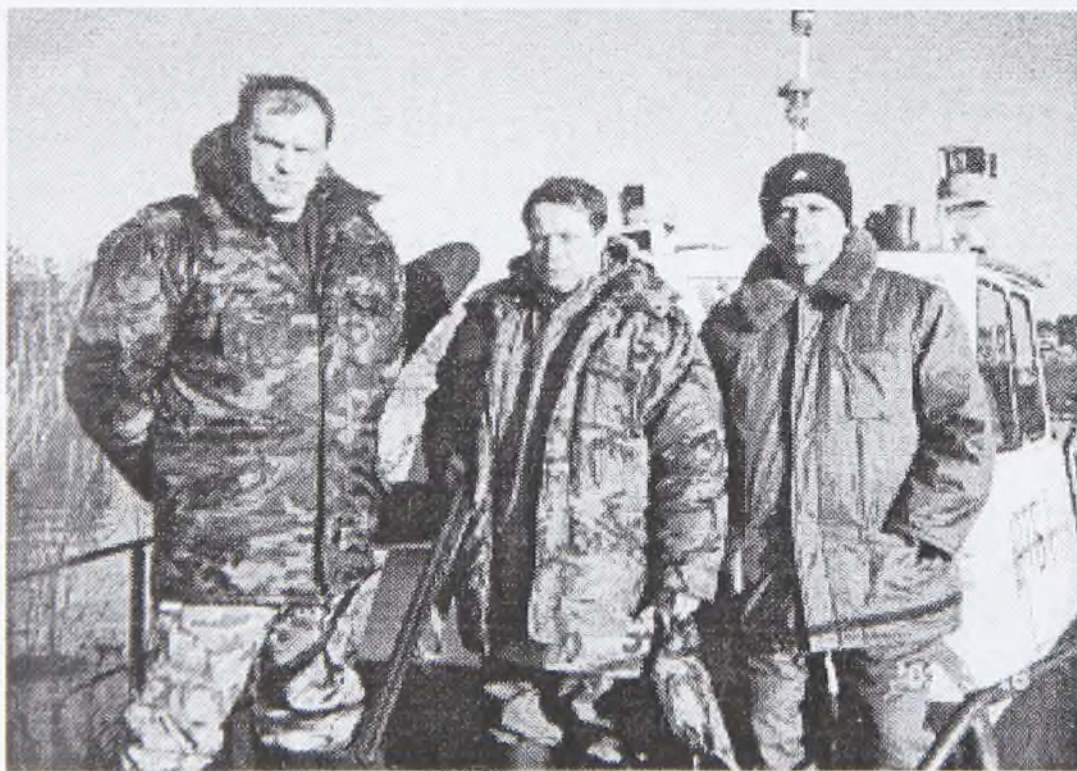
Экспедиция по притокам Ваха. 2003 г.