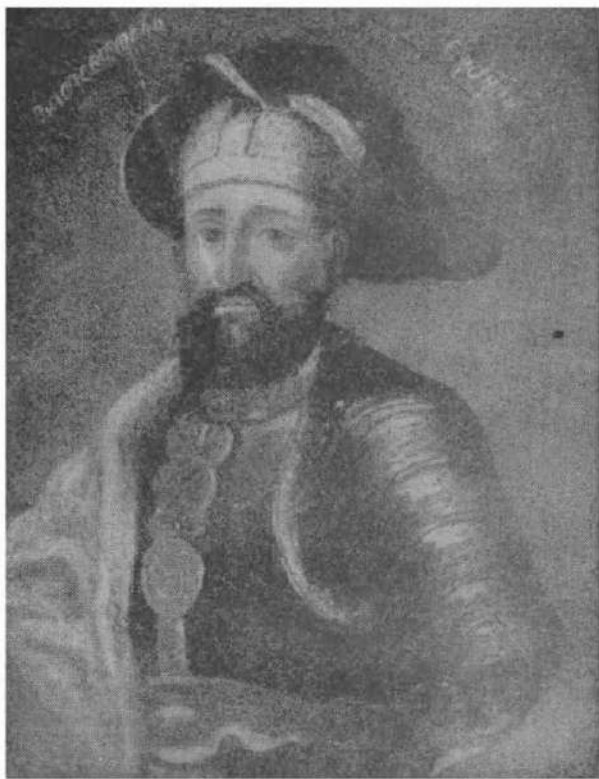
Ермак. Портрет неизвестного художника XVIII века. Тобольский музей.