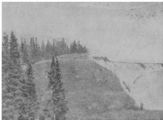
Искер. Фото 1960-х годов.

Во внутреннюю жизнь улусов хан и его сановники почти не вмешивались 1 .