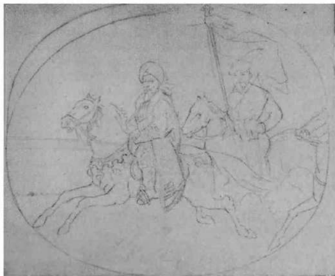
Бегство Кучума. Контурный рисунок М Знаменского. Тобольский музей.

терны налеты на противника массой, поражение его металлическим оружием и широкий маневр на поле боя. Татарская конница нуждалась в открытом пространстве, на котором можно развернуться широким фронтом, окружить неприятеля и ударить его во фланги. Ермак обнаружил и слабое место своего противника — бой в пешем строю. Татары, лихие наездники, отлично дрались на конях, действуя копьем и саблей, но весьма неохотно вступали в рукопашный бой. Бросаясь в схватку толпой, без боевых по-