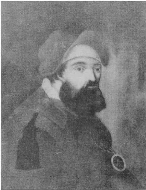
Ермак. Портрет неизвестного художника. Железо. Масло. Тобольский музей.