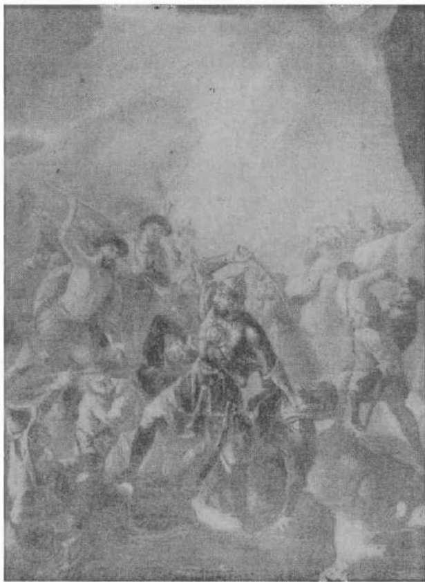
Последняя битва Ермака. Картина неизвестного художника XVIII века.