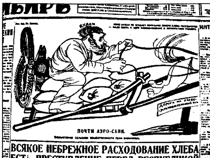
Советская Сибирь. 1929. 24 марта

недовыполнения годового плана по состоянию на 20 марта. Непосредственно в деревню была направлена армия уполномоченных, задачей которых было навязывание крестьянам поселенных планов и их подворная разверстка.