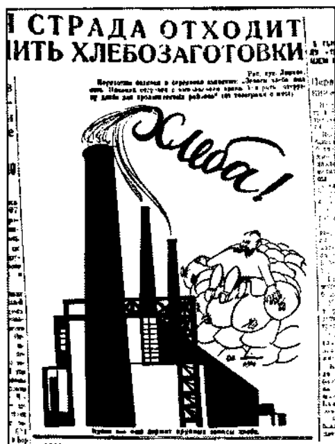
Советская Сибирь. 1929. 28 мая

полнения даже с применением чрезвычайных мер представлялось абсолютно невозможным. В то же время потребность в зерне возросла. Часть накопленных в марте — апреле государственных резервов была использована для посева погибших на Украине озимых. Крайне напряженным оставалось продовольственное положение в городах и потребляющих районах. Ситуацию необходимо было стабилизировать, так как неудовлетворенный спрос на хлеб мог осложнить начало предстоящей заготовительной кампании и отрицательно сказаться на ее результатах в целом. В связи с этим СТО 7 мая принял обязательное минимальное задание по заготовкам продовольственных культур на май, июнь и июль 1929 г. в размере 55 млн пудов 206 . Срок окончания кампании, таким образом, переносился на месяц.