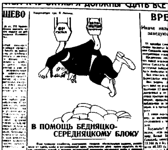
Советская Сибирь. 1929. 10 окт.

октябрь. От колхозов поступило всего лишь 16 % от запланированного на месяц объема хлебосдачи. Виновными были названы окружные парткомы и окрисполкомы, которые «не организовали работу, обеспечивающую выполнение октябрьского задания, [и] продолжают свою неорганизованность, неповоротливость, пассивность прикрывать объективными условиями, ссылаясь [на] плохую погоду». В связи с этим бюро крайкома предупредило секретарей окружкомов и председателей окрисполкомов Барнаульского, Славгородского, Каменского, Рубцовского, Минусинского и Канского округов, «что [в] случае, если [в] четвертую пятидневку ими не будет достигнуто резкое увеличение поступления хлеба, они будут привлечены [к] партийной ответственности». Руководители остальных округов предупреждались, «что они также будут привлечены [к] партийной ответственности при рассмотрении четвертой пятидневки [в] случае, если результаты следующей пятидневки не будут доведены [до] таких размеров, которые бы обеспечивали выполнение полностью октябрьского плана». Кузнецкий и Бийский окружкомы получали выговор «[за] снижение результатов хлебозаготовок [в] третью пятидневку, что явилось вследствие благодушия результатами первых двух пятидневок».