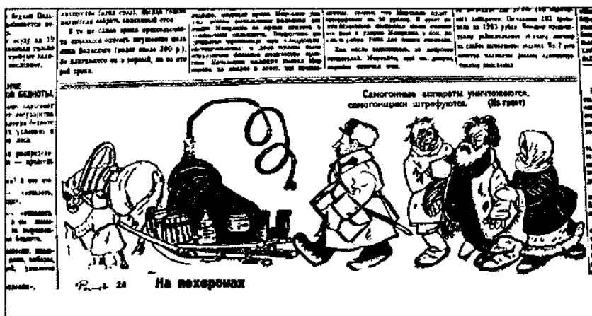
Советская Сибирь. 1928. 28 янв.

Рецессии следовало обрушить и на самогонщиков. 27 декабря 1927 г. ЦИК и СНК СССР приняли постановление «О мерах усиления борьбы с самогонварением», в котором предложили ЦИК союзных республик в двухнедельный срок внести в уголовные кодексы в число уголовно-наказуемых деяний самогонварение без цели сбыта, а также хранение самогона и аппаратов без цели сбыта 63 . С 1926 г. преследовалась только продажа самогона. Соответствующее решение ВЦИК было принято в тот же день. Наказание за тайное винокурение увеличилось с двух недель принудительных работ или штрафа в 25 руб. до месяца принудительных работ или штрафа в 100 руб. 64