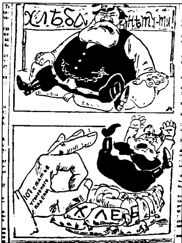
Советская Сибирь. 1928. 29 янв.

8. Организацию нажима на хлебозаготовительном фронте считать ударной задачей партийных и советских организаций, а самый нажим продолжать вплоть до полного выполнения плана заготовок».