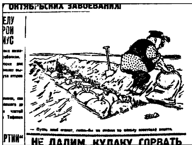
Сельская правда. 1929. 29 авг.

ре, лишенных прав, обложенных индивидуально, с тем чтобы была применена максимально возможная мера репрессий — конфискация имущества и высылка, [в] отдельных случаях — расстрел. Процессы должны быть обеспечены широкой массовой работой среди бедноты [и] середняков, [с] тем чтобы [с] их стороны была безусловная поддержка этих репрессий. Показательные процессы должны широко, умело освещаться [в] печати, создавая общественное мнение [о] неизбежности поражения кулака» 108 .