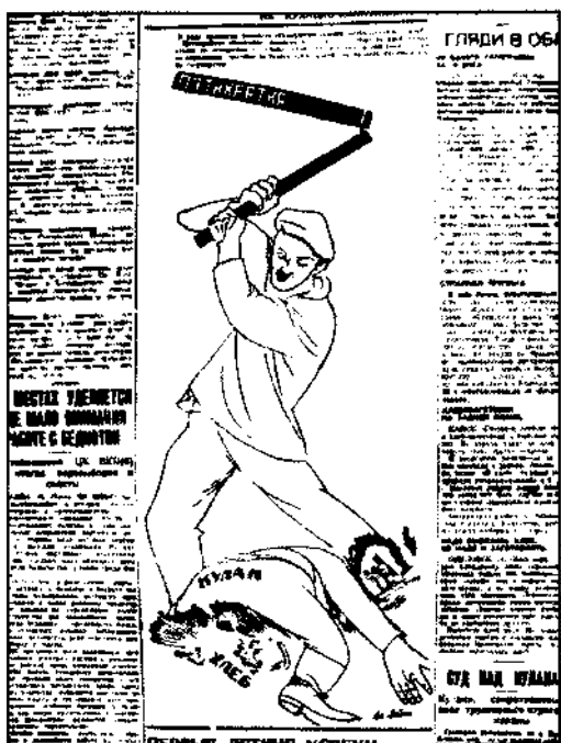
Советская Сибирь. 1929. 15 июня

и т. п., командирова на места происшествий представителей окружных организаций». Кроме того, бюро крайкома признало «совершенно недопустимым все еще наблюдающиеся случаи ограничения базарной торговли хлебом» и предложило окружкомам «немедленно отменять такие ограничения» 218 .