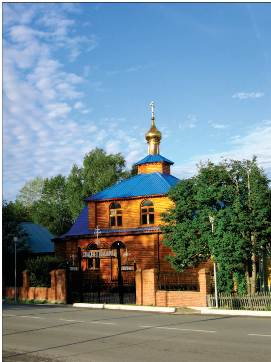
Храм в честь иконы Божией Матери «Знамение». г. Ханты-Мансийск, 2007 г.