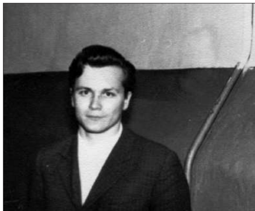
Внук Спиридона Егоровича, главное действующее лицо повести. Трудные годы студенчества... г. Тюмень. Апрель 1970 г.