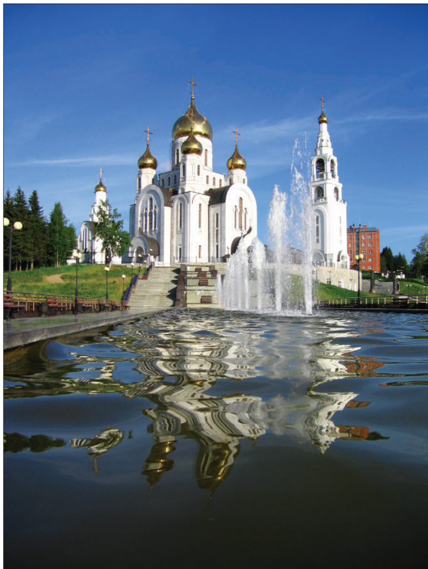
Храм в честь Воскресения Христова. г. Ханты-Мансийск, 2008 г.