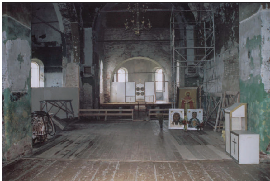
Внутреннее помещение храма Покрова Божьей Матери (июль 2007 г.). Видны разрушения историко-культурного памятника XIX века