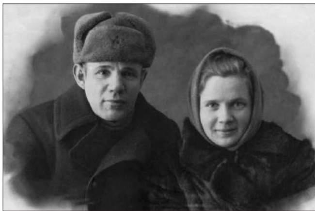
Директор рыбного техникума г. Тобольска с молодой женой (1944 г.).