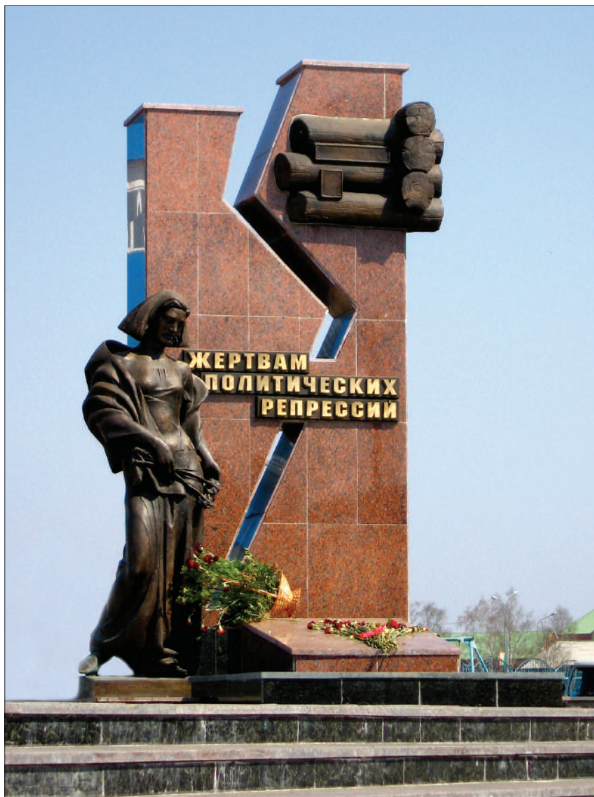
Расколотый на две части мир – на «белых» и на «красных» – запечатлён в памятнике жертвам политических репрессий, установленном в Ханты-Мансийске в 2006 году (скульптор – Владимир Арсенович Саргсян)